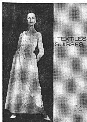
JACQUES HEIM Organza brodé avec motifs de guipure de Forster Willi & Co., Saint-Gall. Grossiste à Paris: Robert Burg & Cie