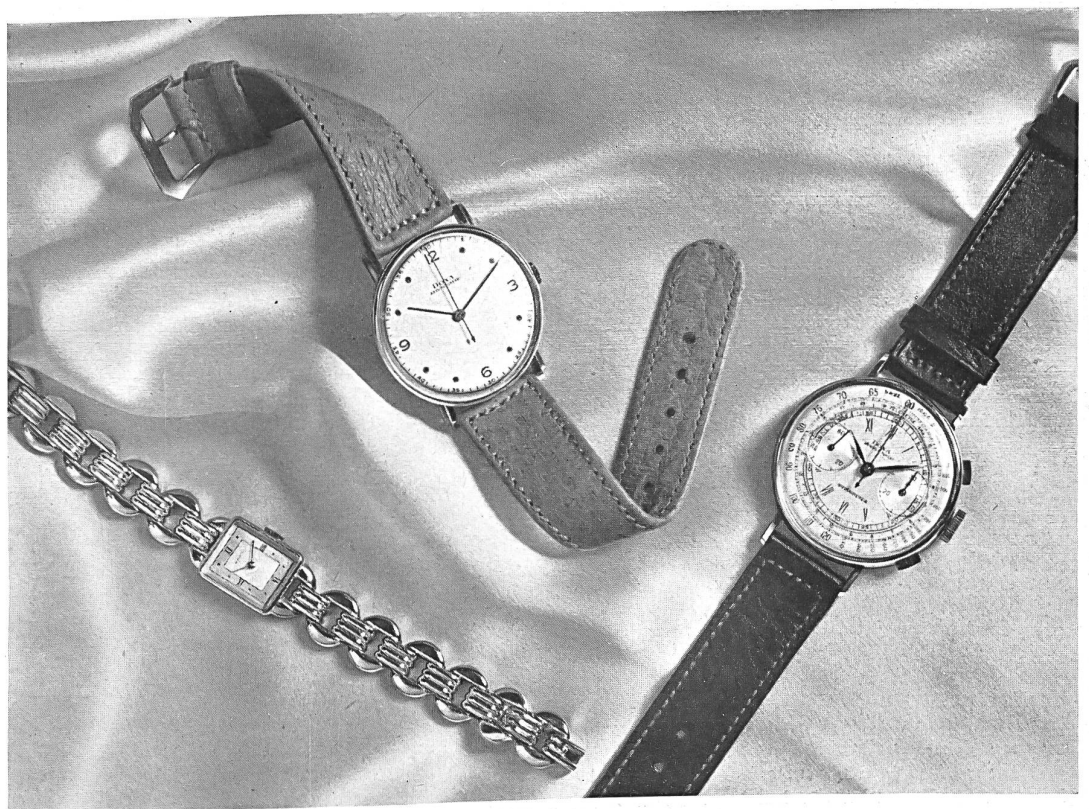
Manufacture des Montres Doxa, Le Locle.