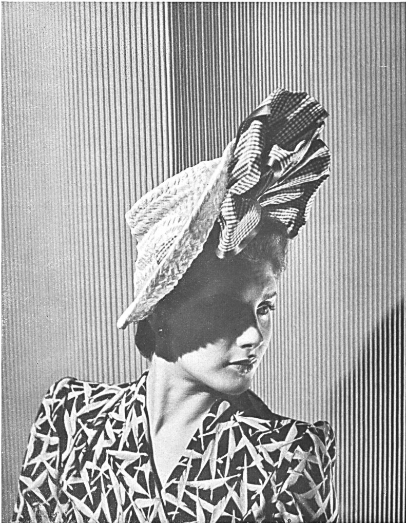
Chapeau remaillé en « YOVETTE ». Model for early spring in « YOVETTE ». Sombrero para la primavera, de « YOVETTE ». Modèle Muller, Zurich.