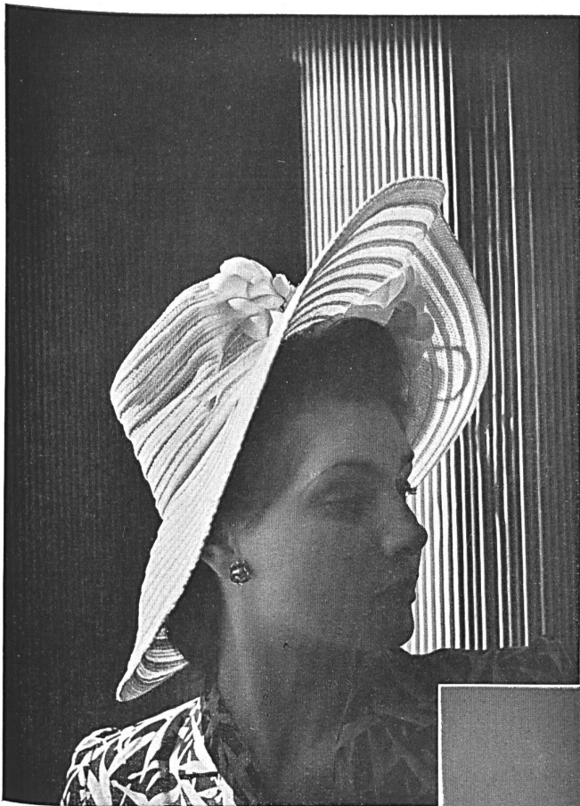
Chapeau d'été cousu en paille fantaisie « 2334 ».

Summer hat in fancy braid « 2334 ». Sombbrero de verano, de paja fantasía « 2334 ».