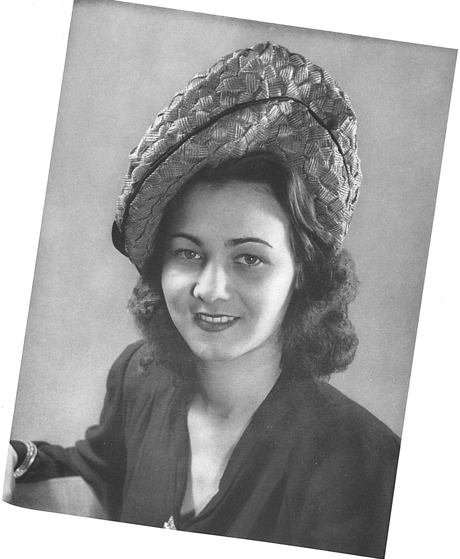
Jacques Isler & Cie S. A., Wohlen. Chapeau en tresses de paille « RAPOLINE ». Model in « RAPOLIN » strawbraid. Sombrero de trenzado de paja « RAPOLIN ». Modèle Floral, Genève.