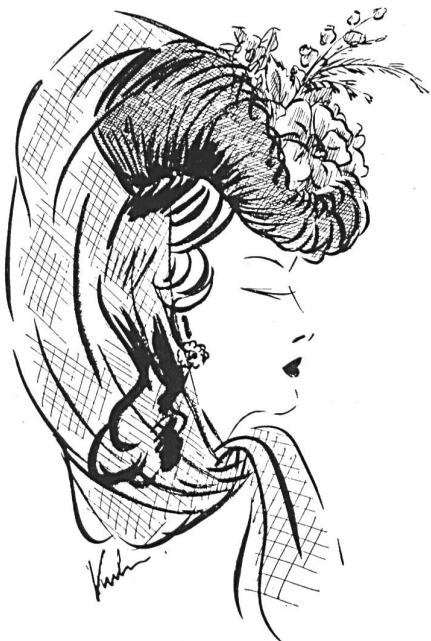
Chapeau cousu en picot « DEFRESA 2225 ».

Young lady's hat in picot « DEFRESA 2225 ».