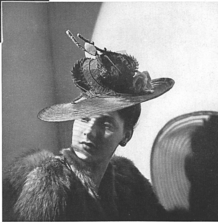
Chapeau habillé, en crin « 4559 ».

Large, handworked millinery model in black hairbraids « 4559 ».