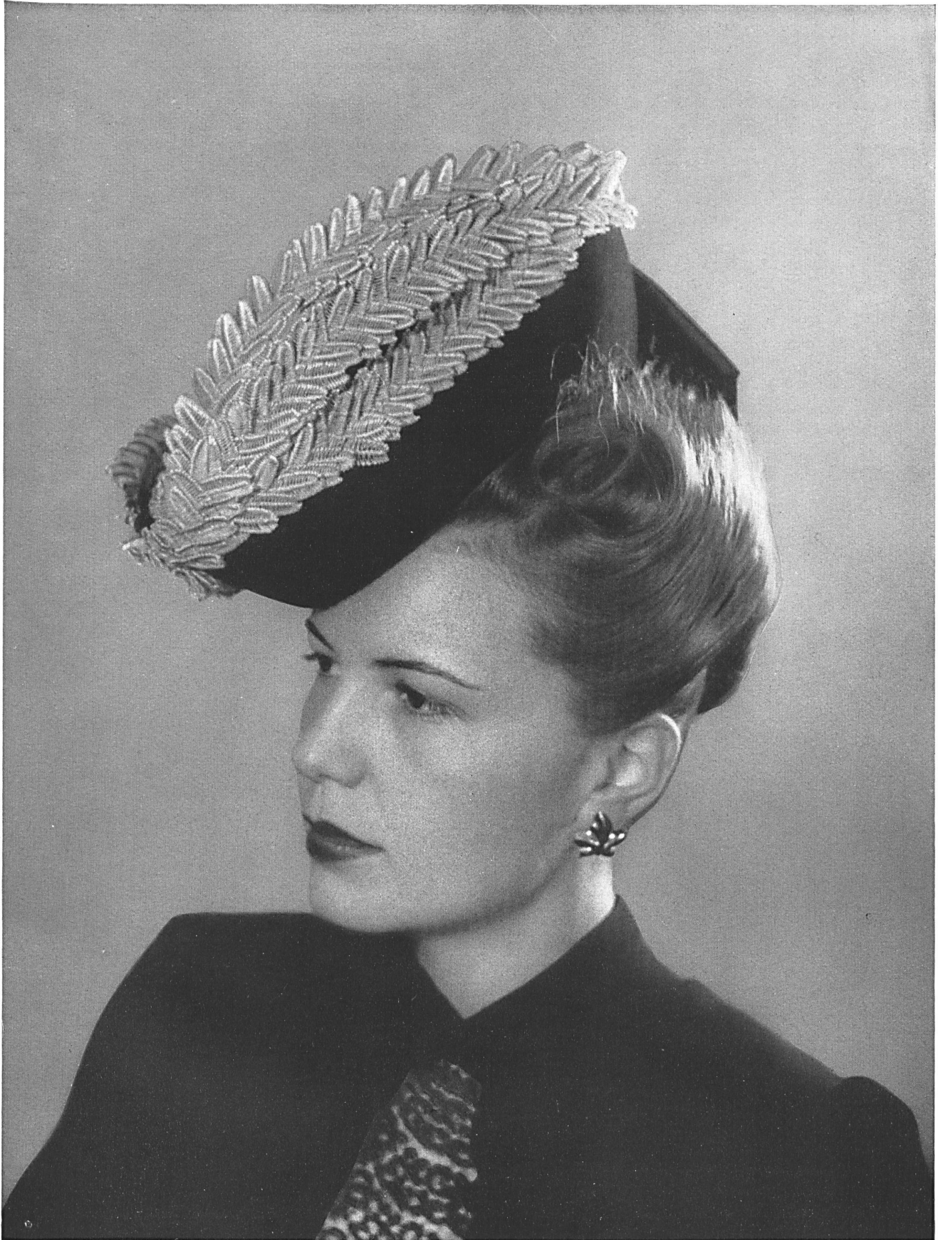
Chapeau en tresses de paille de A model in strawbraid manufactured by Sombrero en trenzado de paja de la firma M. Bruggisser & Cie S. A., Wohlen. Modèle Berthe Peney, Genève.