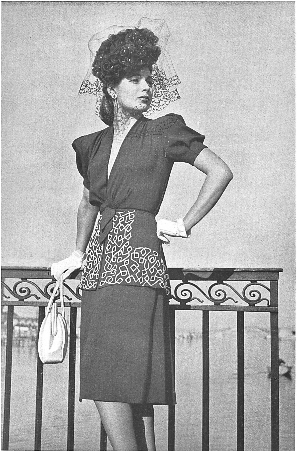
Tissages de soieries, ci-dev. Näf Frères S. A., Zurich. Crêpe « Evelyne » en rayonne. « Evelyne » rayon crêpe. Crepe « Evelyne » de rayon. Modèle Léon Fischer.