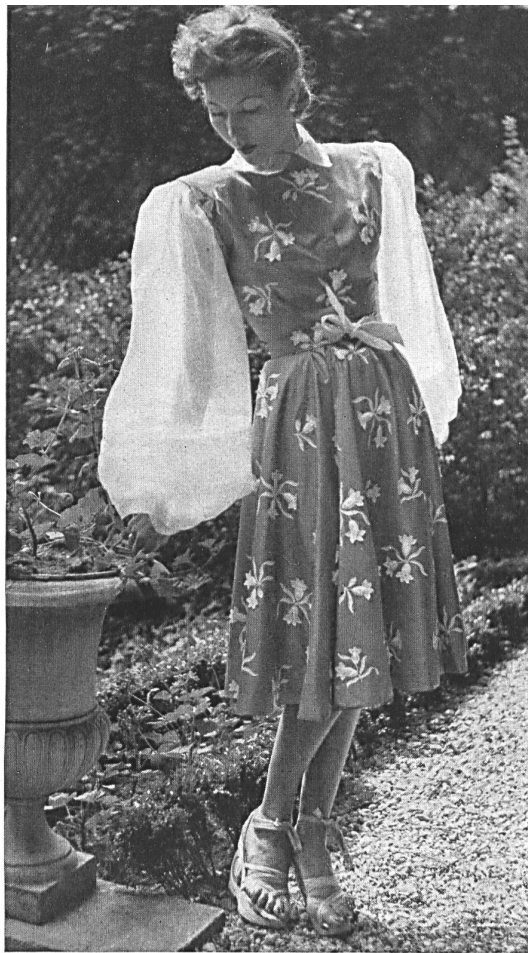
JACQUES FATH. Stoffel — Naef, Flawil