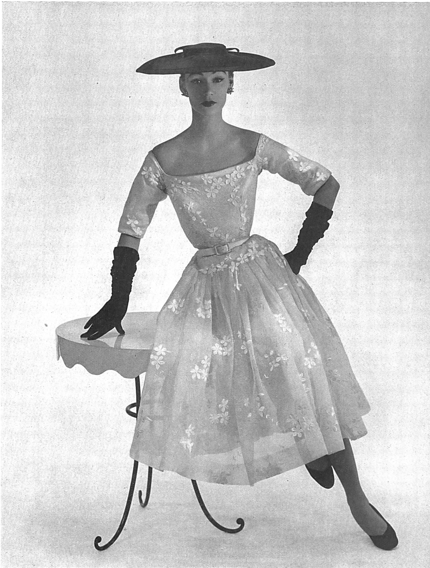
BALENCIAGA Organdi brodé de J. G. Nef & Cie, Hérisau.