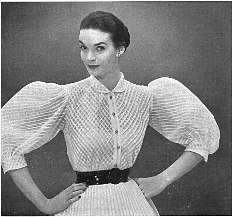
Gibson blouse in a novelty Swiss voile with transparent and opaque stripes separated by drawnthread work, by Frances Sider .

and wool challis with paisley designs for the peasant skirts so popular with college girls. Springs of flowers in pastel shades were printed on embroidered organdies with open-work stripes. This combination of embroidery and printing gives a very new and original effects. An amusing rustic scene with flocks of sheep, houses and people unfolds itself all along the top of a green organdy skirt. There were fine matelassé fabrics, both light and comfortable and perfect for outdoor wear. One extraordinarily smart dress was in very supple and shiny chintz, black with a fine white stripe. Organdies were handled with great skill and there was no sparing of the fabric in the full skirts where four layers of the same white organdy gave the dress a translucent effect like a fine Chinese porcelain. Embroideries in cellophane straw, in braid and in raffia gave a raised effect to plain organdy dresses.