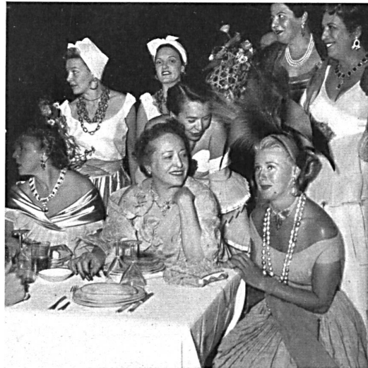
Madame Vargas, femme du président des Etats-Unis du Brésil (au centre) s'entretient avec la vedette Ginger Rogers.

Furthering a tradition established already many years ago by the big couturiers, Jacques Fath organizes receptions as amusing as they are bright, to which his castle of Corbeville, at some 30 miles from Paris, offers an ideal setting. At the beginning of August, this residence saw some eighteen hundred people who came at the invitation of Mr. and Mrs. Jacques Fath to celebrate a « Carnival at Rio » that was rendered more genuine through the presence of a great number of Brazilians, in the first row of whom, we must name Senhora Vargas, wife of the President of Brazil, who came purposely from Rio for the occasion. Mr. Assis de Chateaubriant, a big Brazilian newspaper editor, was also present. In this exotic atmosphere, the cabaret, stage and screen, Paris, Hollywood and the Orient, diplomacy, finance and titled people, Arts, couture, press, brushed shoulders and danced until morning to the tune of an orchestra specially brought by air from Rio. Variety entertainments — among them those of the master of the house himself were much admired — enlivened an atmosphere already very gay. We cannot for lack of space, give a fuller account of this very successful party, which was the most outstanding event of the summer season, besides, all the newspapers have spoken of it, therefore we only content ourselves in reproducing here a few snapshots.