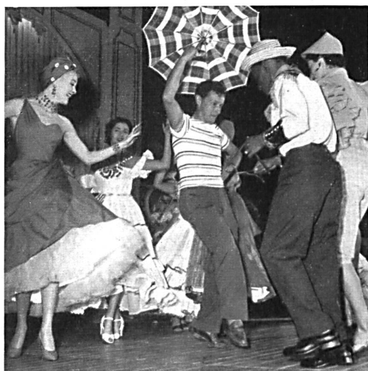
Jean-Louis Barrault présente une danse brésilienne, le « curucu ».