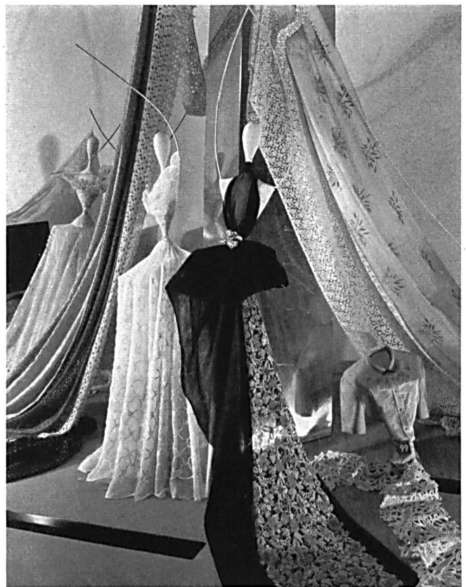
Coup d'œil sur la présentation des broderies et tissus fins de Saint-Gall. A glimpse of the presentation of embroideries and fine fabrics from St. Gall.