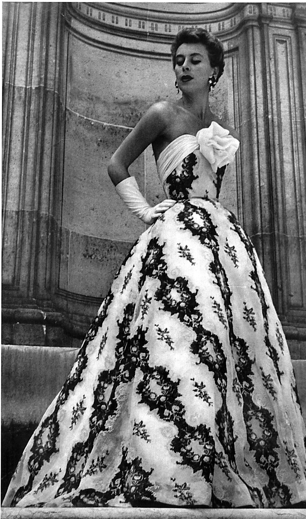
HUBERT DE GIVENCHY Broderie, imitation « tapisserie petit point », sur organdi, de Forster Willi & Co., St-Gall ; pla- cée par Inamo, Zurich.