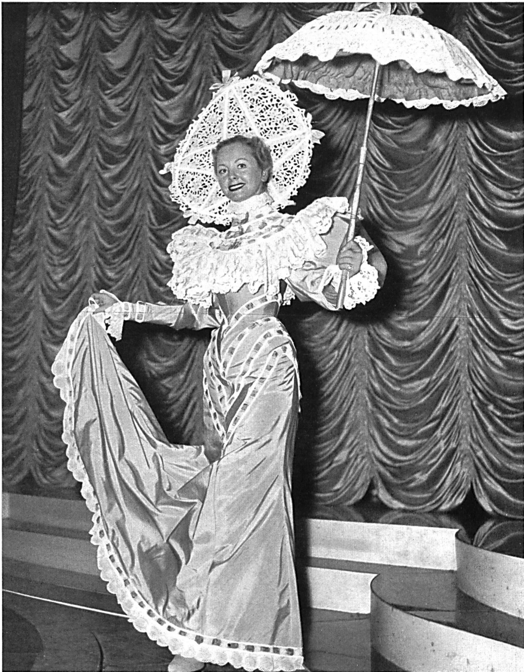
Guipure blanche, broderie anglaise, passe-ruban.