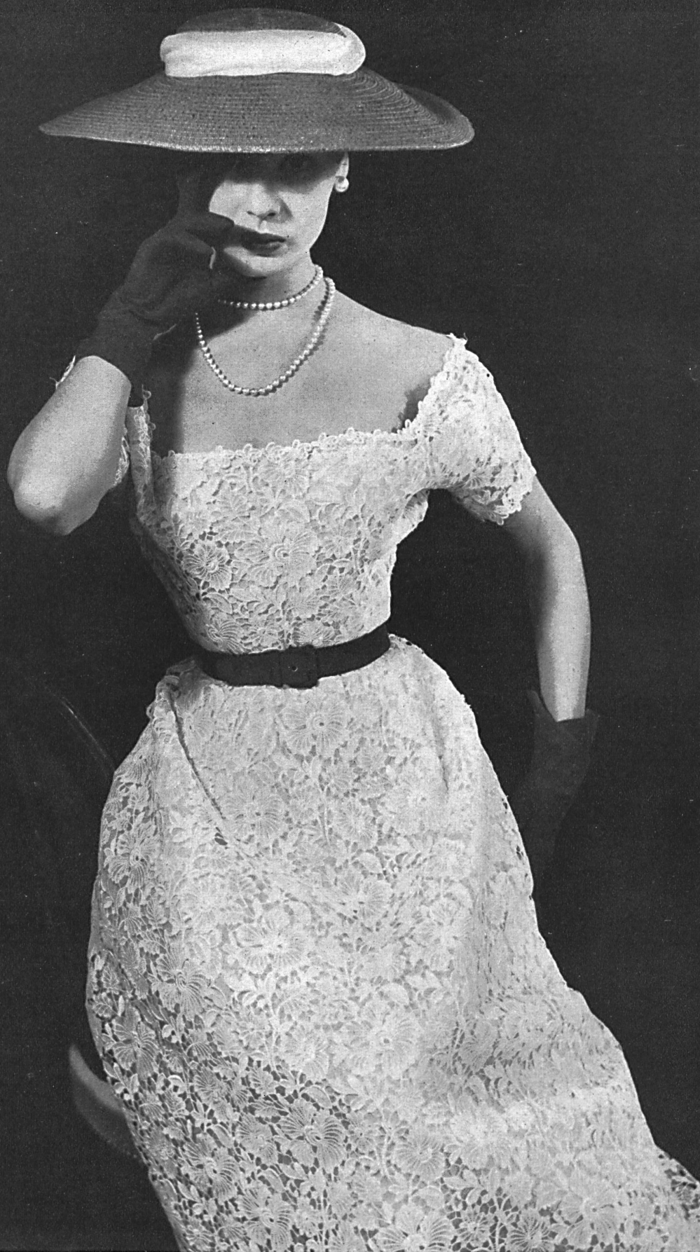
CHRISTIAN DIOR Dentelle de guipure de Forster Willi & Cie, St-Gall; grossiste à Paris : Pierre Brivet S. à r. l.