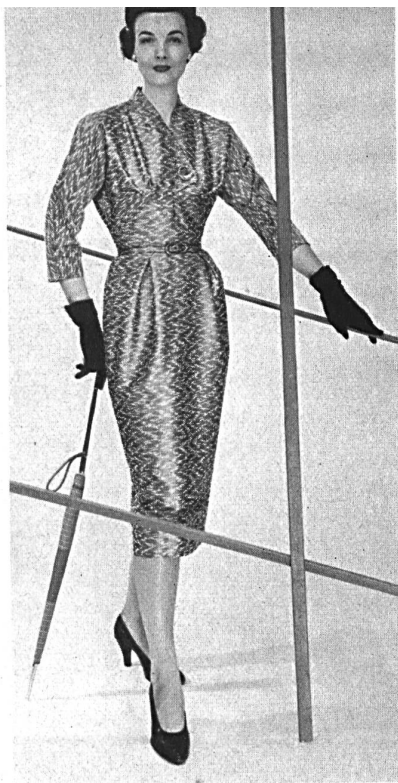
Marrakech façonné. Modèle Halldéns, Stockholm.