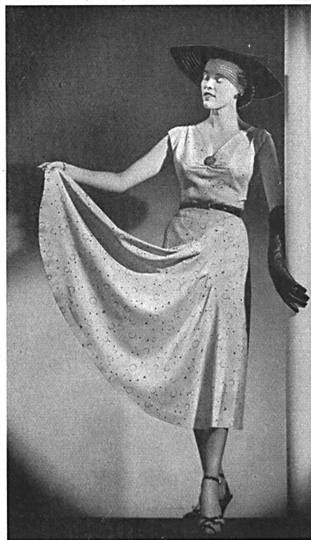
Kiang-Su imprimé. Modèle M. K. Manufacturers Ltd., Auckland.