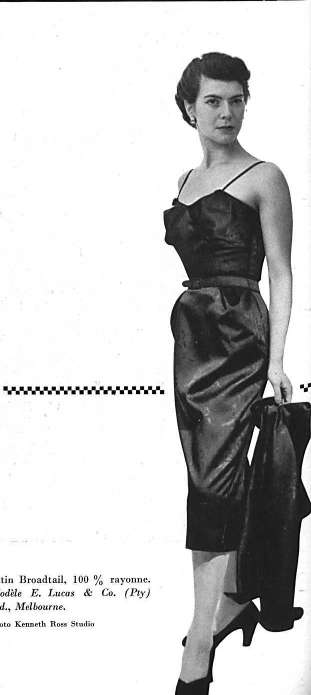
Satin Broadtail, 100 % rayonne. Modèle E. Lucas & Co. (Pty) Ltd., Melbourne.