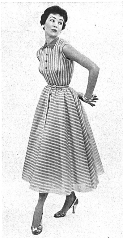
Farfalla barré. Modèle Susan Small Ltd., Londres.