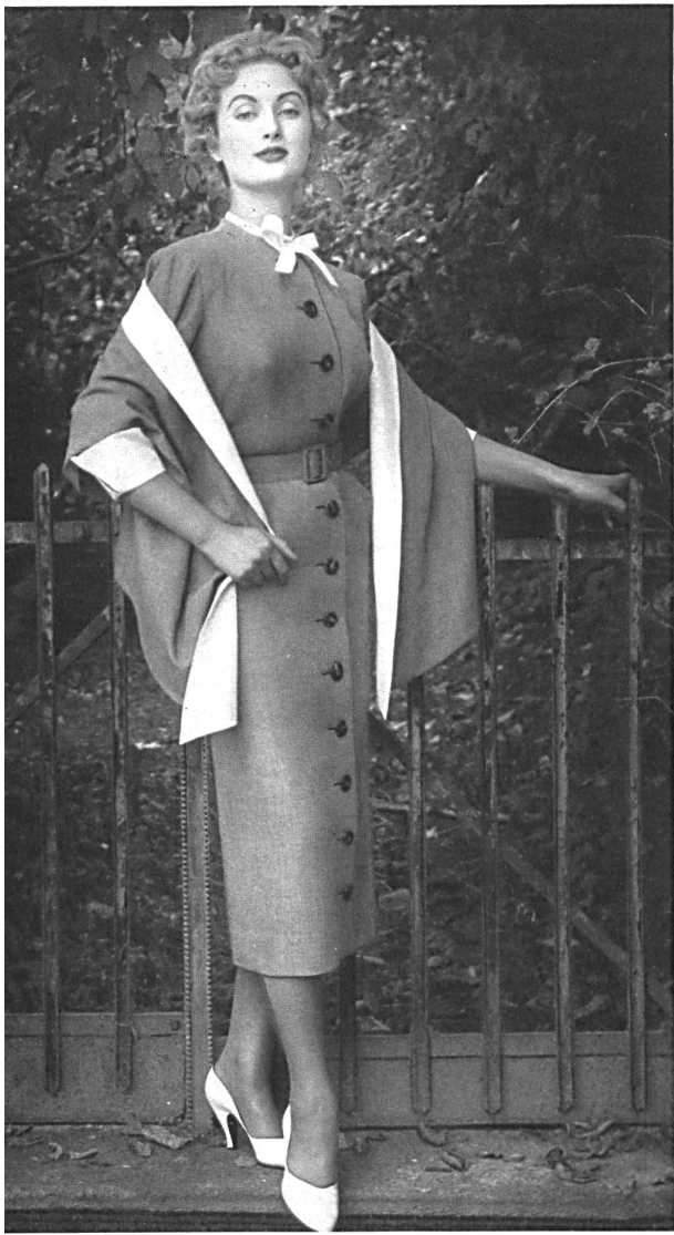
Tweed Belrobe fibranne. Modèle R. Cafader & Cie, Zurich.