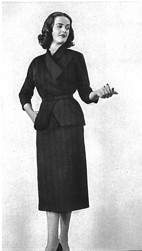
Grosgrain couture, rayonne et fibranne. Modèle Peggy Fashions (Pty) Ltd., Johannesburg.