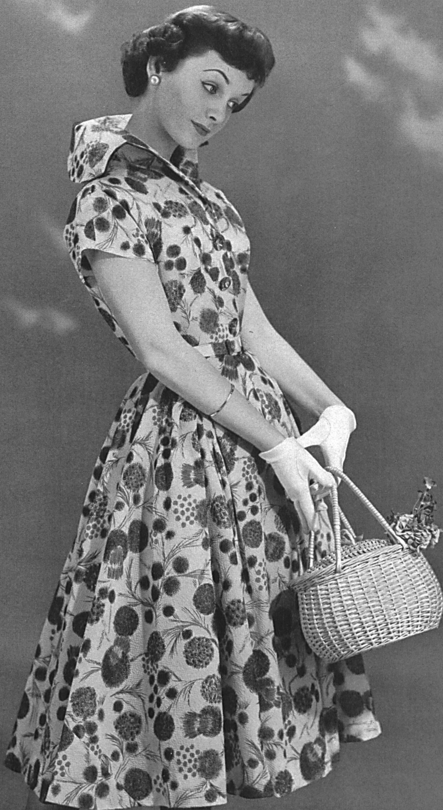
Nylon imprimé. Modèle Willy Meyer S. A., Zurich.