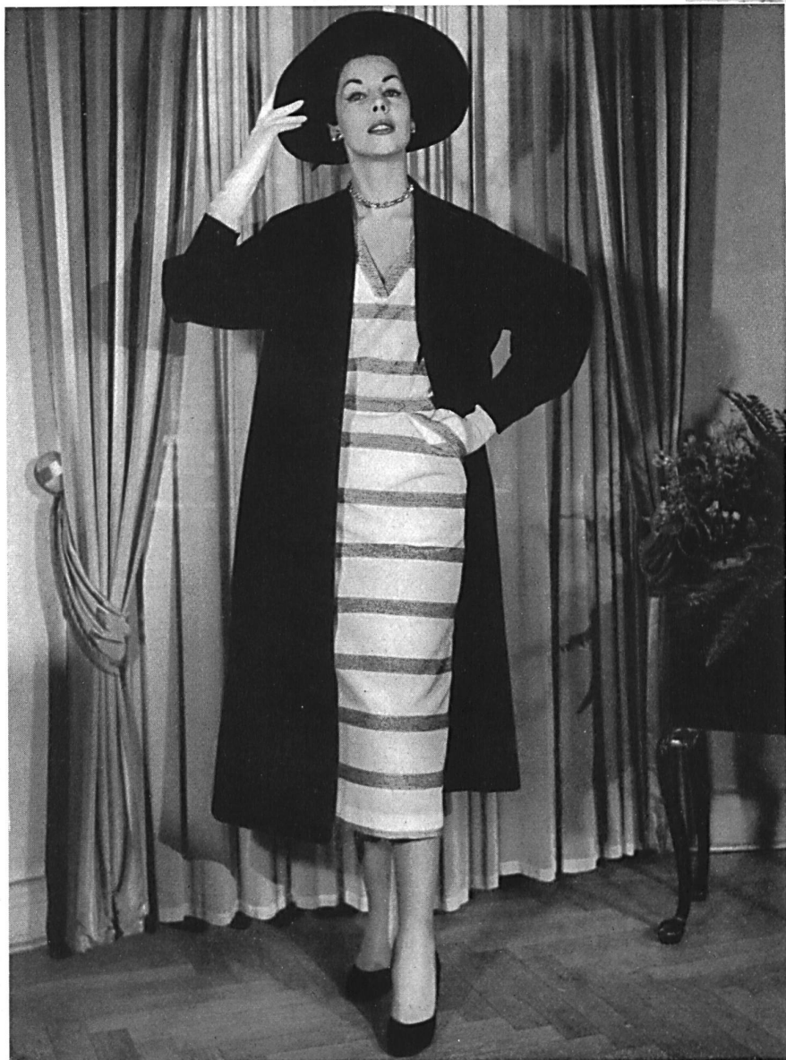
Bouclé Sport, 100 % rayonne. Modèle Bengtsons Konfektions A. B., Stockholm.