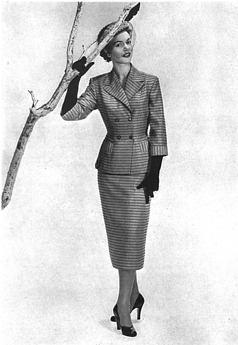
Fresco barré, rayonne et fibranne. Modèle Hellas Mfg. Co. (Pty) Ltd., Cape Town.