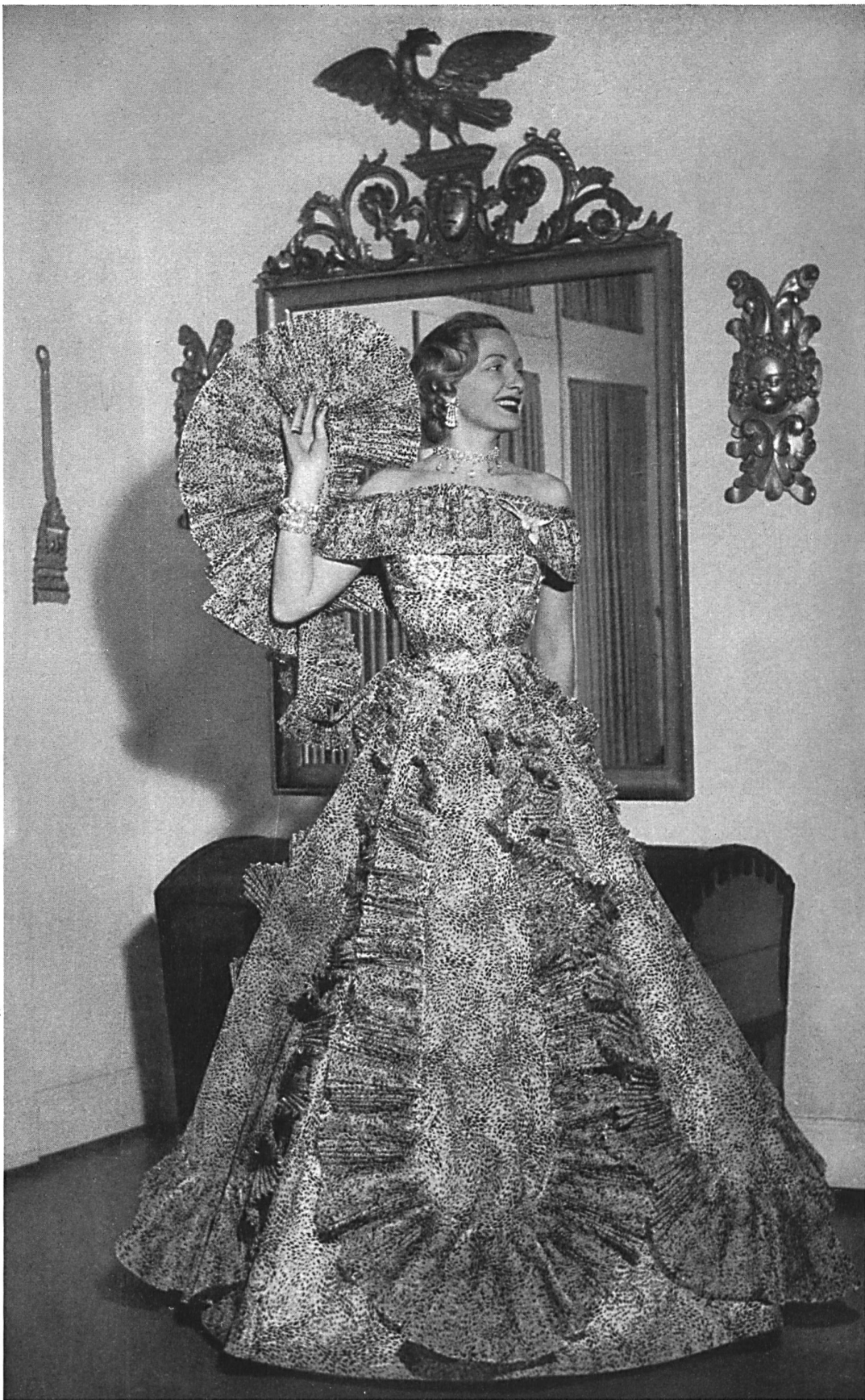
Flocosa, organdi de coton imprimé flock noir. Modèle Fred Spillmann, Bâle.