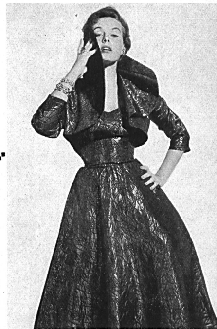
Matelassé façonné lamé. Modèle Hartnell Garment Co., Melbourne.