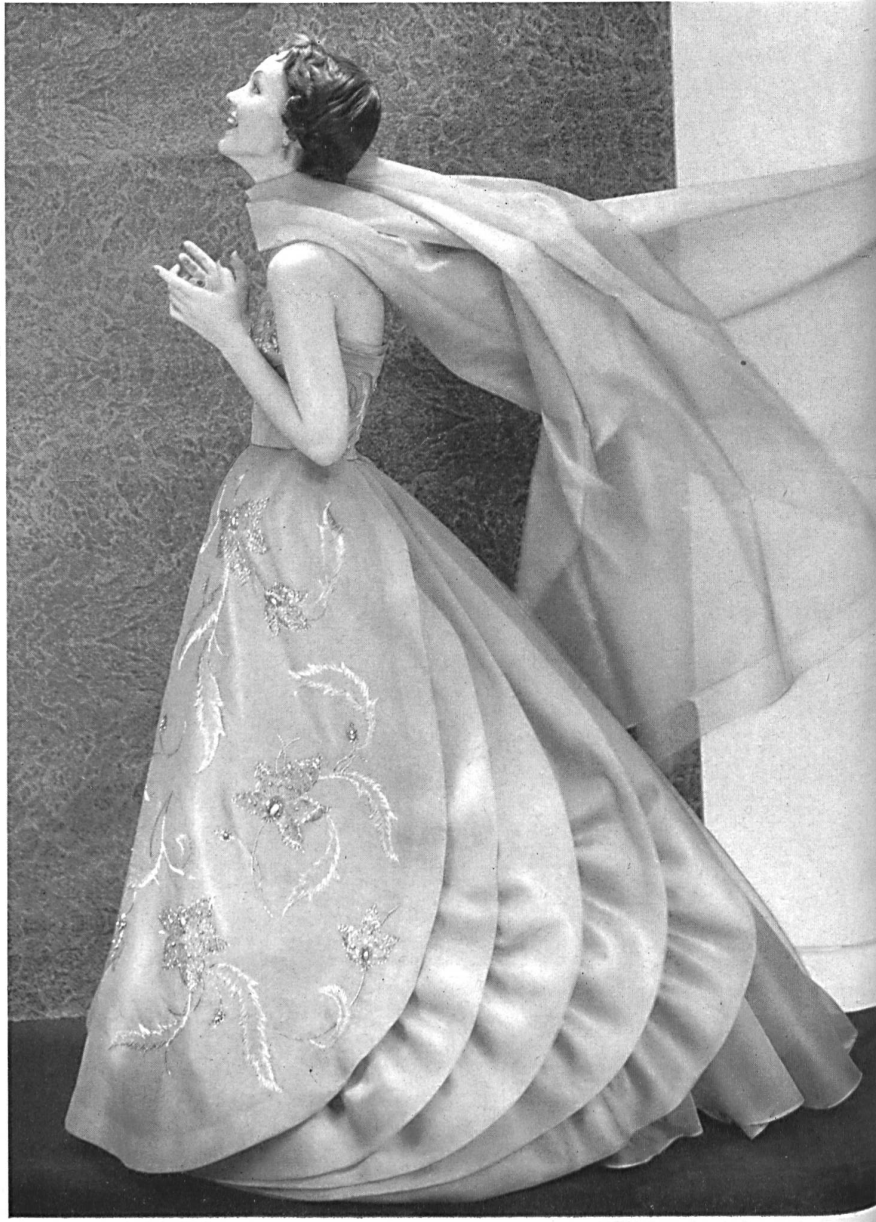
Organza pure soie. Modèle Marty & Cie, Zurich.