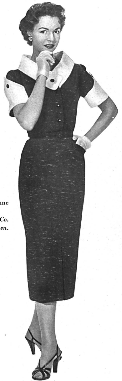
Toile Haruko, rayonne et fibranne. Modèle Hellas Mfg. Co. (Pty) Ltd., Cape Town.