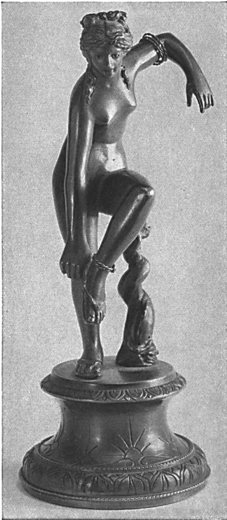
Venus Anadyomene. A bronze statuette in the Bally Shoe Museum [at Schoenenwerd.