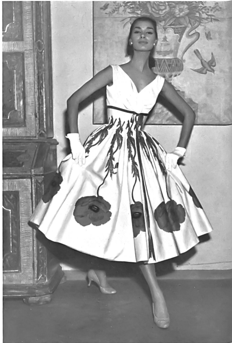
2 Pavots imprimés, rouge sur blanc. Papaveri stampati, rosso sopra bianco. Modèle: Veneziani, Milan