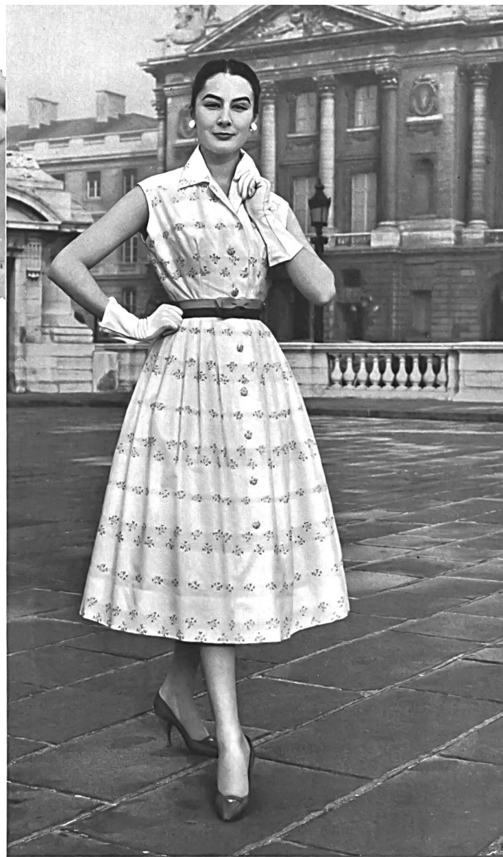
REICHENBACH & CO., SAINT-GALL « Resupra », popeline brodée en couleurs. Modèle : J. Tiktiner & Cie, Nice Montex, Paris