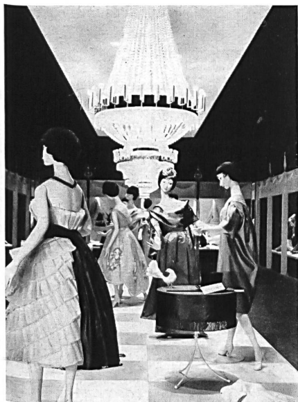
View of the „Madame- Monsieur” exhibition.

year, with a number of collective thematic displays alternating with individual stands forming part of a general scheme. From these the visitor will be able to gain a very good idea of what the knitwear industry has to offer.