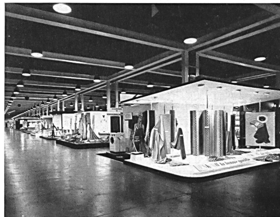
Some of the stands in the textile halls.

The success met with last year by the „Knitwear centre” encouraged its organisers to repeat the idea this