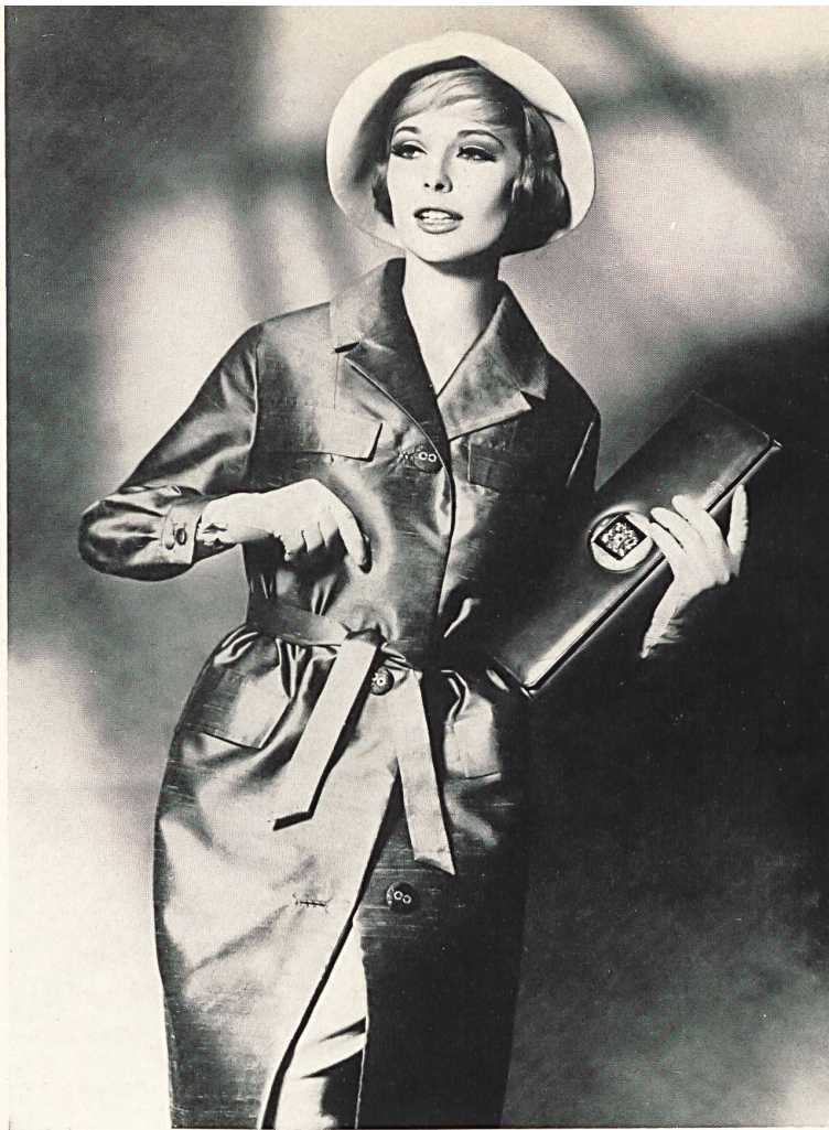
HEER & CIE S. A., THALWIL Shantung pure soie Imperméable de Dumas, Egloff S. A., Châtel-Saint-Denis