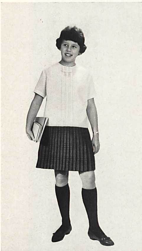
HEER & CIE S. A., THALWIL Térylène/laine (blouse et jupe) Modèle Leumann, Boesch & Cie S. A., Kronbühl