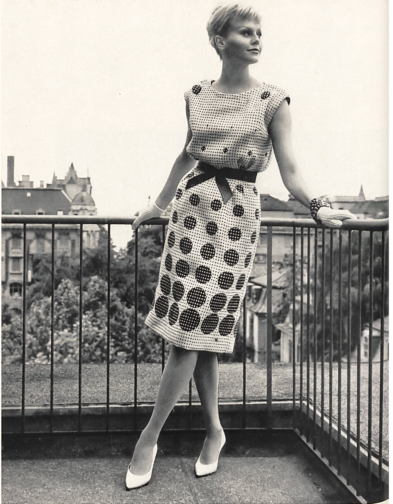
MAX KIRCHHEIMER FILS & CIE, ZURICH Tissu — fabric — tejido — Gewebe Modèle Cortesca A.-G., Zurich