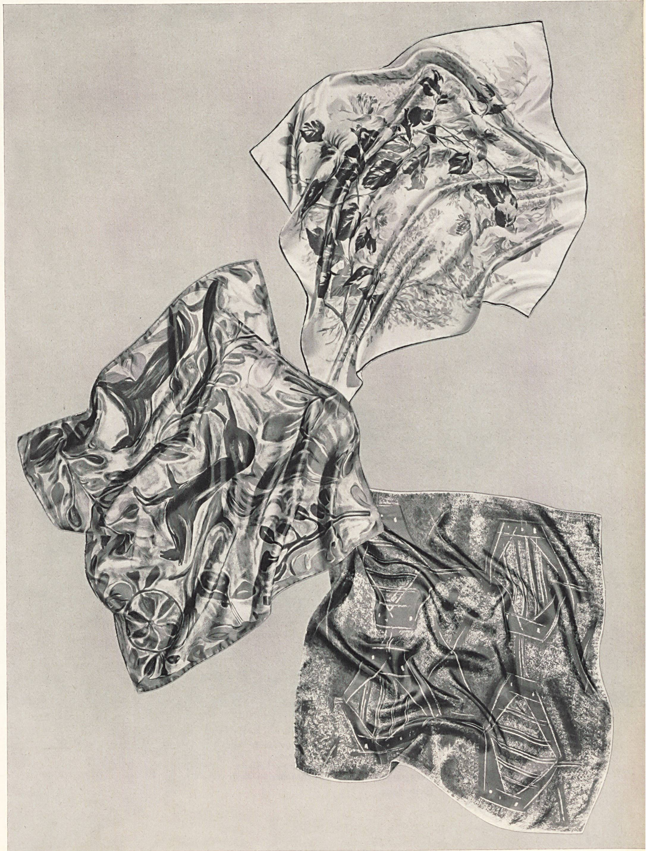
MAVIR, ZURICH Foulards imprimés sur pure soie et rayonne. Pure silk and rayon printed squares. Cuadrados estampa- dos sobre seda pura y rayón. Bedruckte Kopf- tücher in reiner Seide und Rayonne.