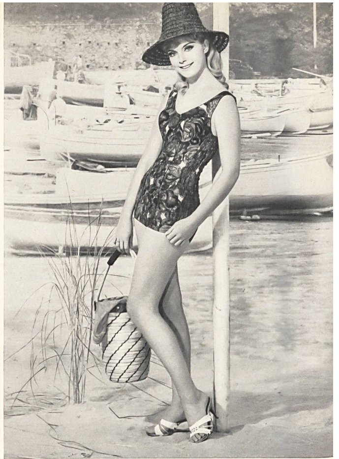
«ROBORO», J. F. ROHRER-BOLLIGER S.A., ROMANSHORN Maillot de bain en coton imprimé, épaulettes larges, profondément échancré dans le dos. — Printed cotton swimsuit, wide straps, deeply plunging back. — Bañador de algodón estampado, con hombreras anchas, muy escotado en la espalda. — Badeanzug aus bedrucktem Baumwollstoff, breite Träger, tiefer Rücken.