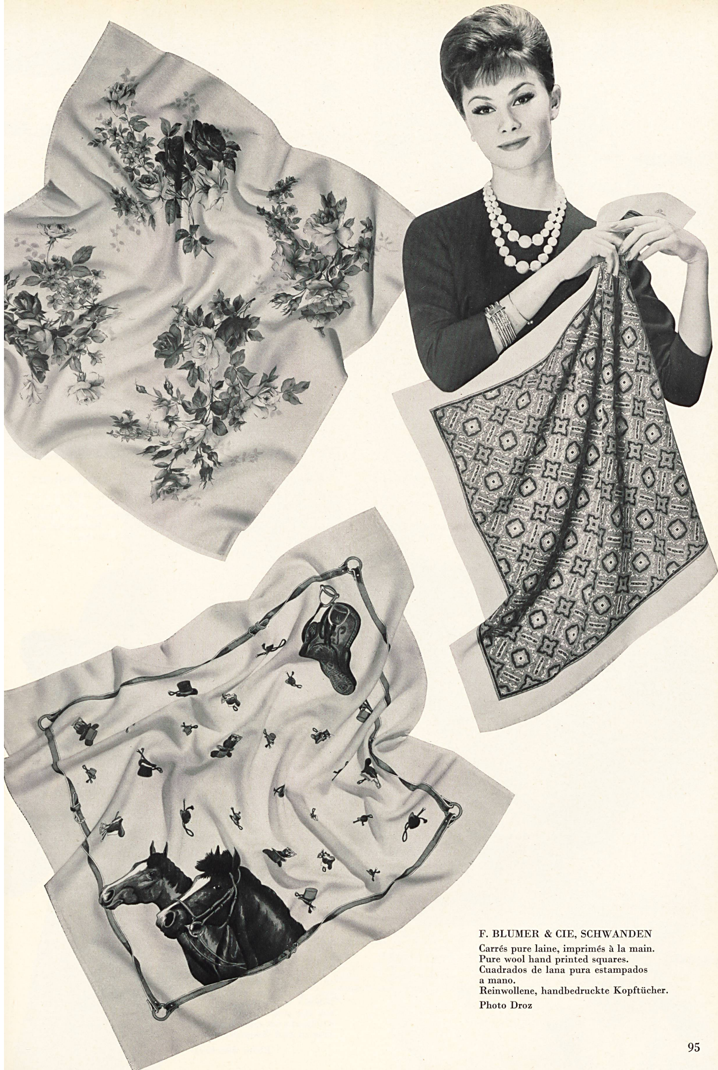
F. BLUMER & CIE, SCHWANDEN Carrés pure laine, imprimés à la main. Pure wool hand printed squares. Cuadrados de lana pura estampados a mano. Reinwollene, handbedruckte Kopftücher.