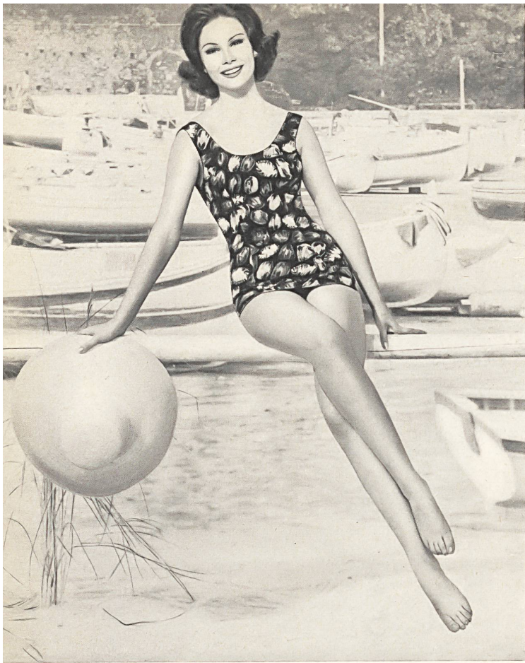
«ROBORO», J. F. ROHRER-BOLLIGER S.A., ROMANSHORN Maillot de bain en tissu «Hélanca» imprimé, épaulettes larges, profondément échancré dans le dos. — Printed «Helanca» swimsuit, wide straps, plunging low at the back. — Bañador de tejido «Helanca» estampado, con hombreras anchas, muy escotado en la espalda. — Badeanzug aus bedrucktem Helanca-stoff, breite Träger, tiefer Rücken.