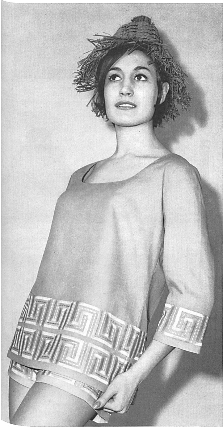
« RECO », REICHENBACH & CO. S. A., SAINT-GALL Batiste « Minicare » brodée / embroidered / bordada / bestickt Modèle Créations Alphée, Alassio