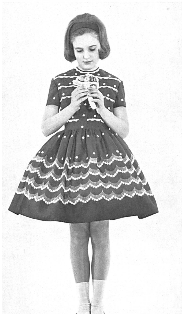
«RECO», REICHENBACH & CO. S. A., SAINT-GALL Batiste « Minicare » brodée / embroidered / bordada / bestickt Modèles Marie-Noelle, Milan