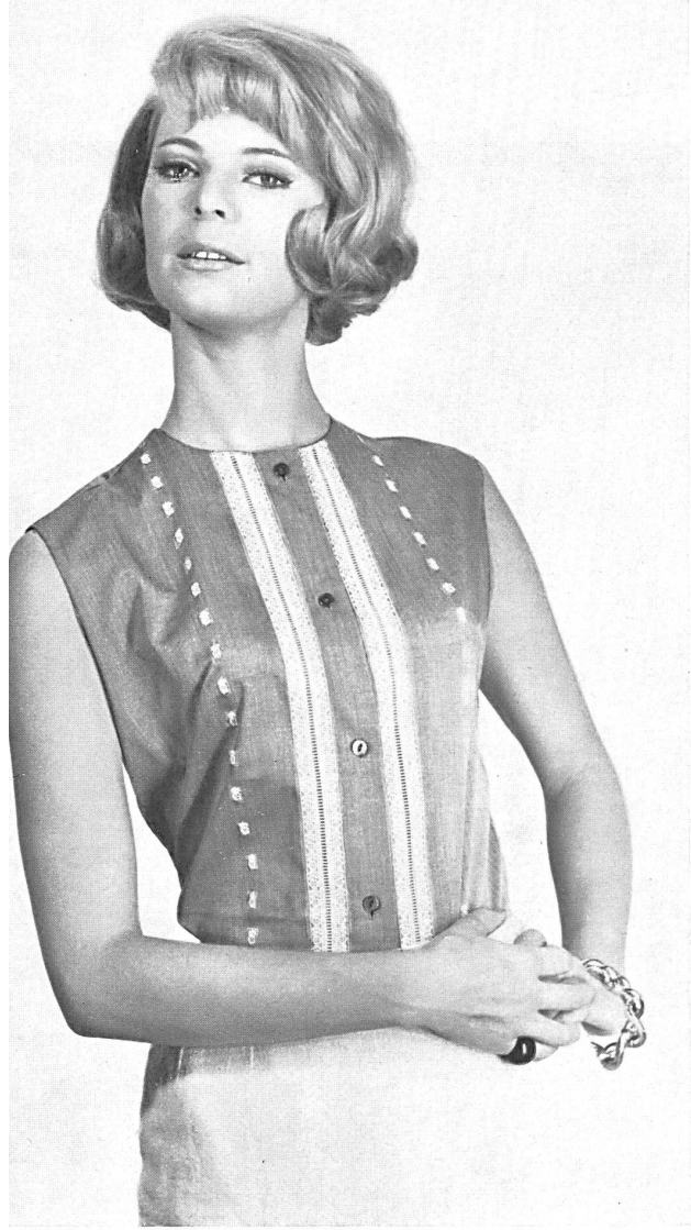
◀ «RECO», REICHENBACH & CO. S. A., SAINT-GALL Chambrai brodé / embroidered / bor- dado / bestickt Modèle Matisse Blouse Co., Londres