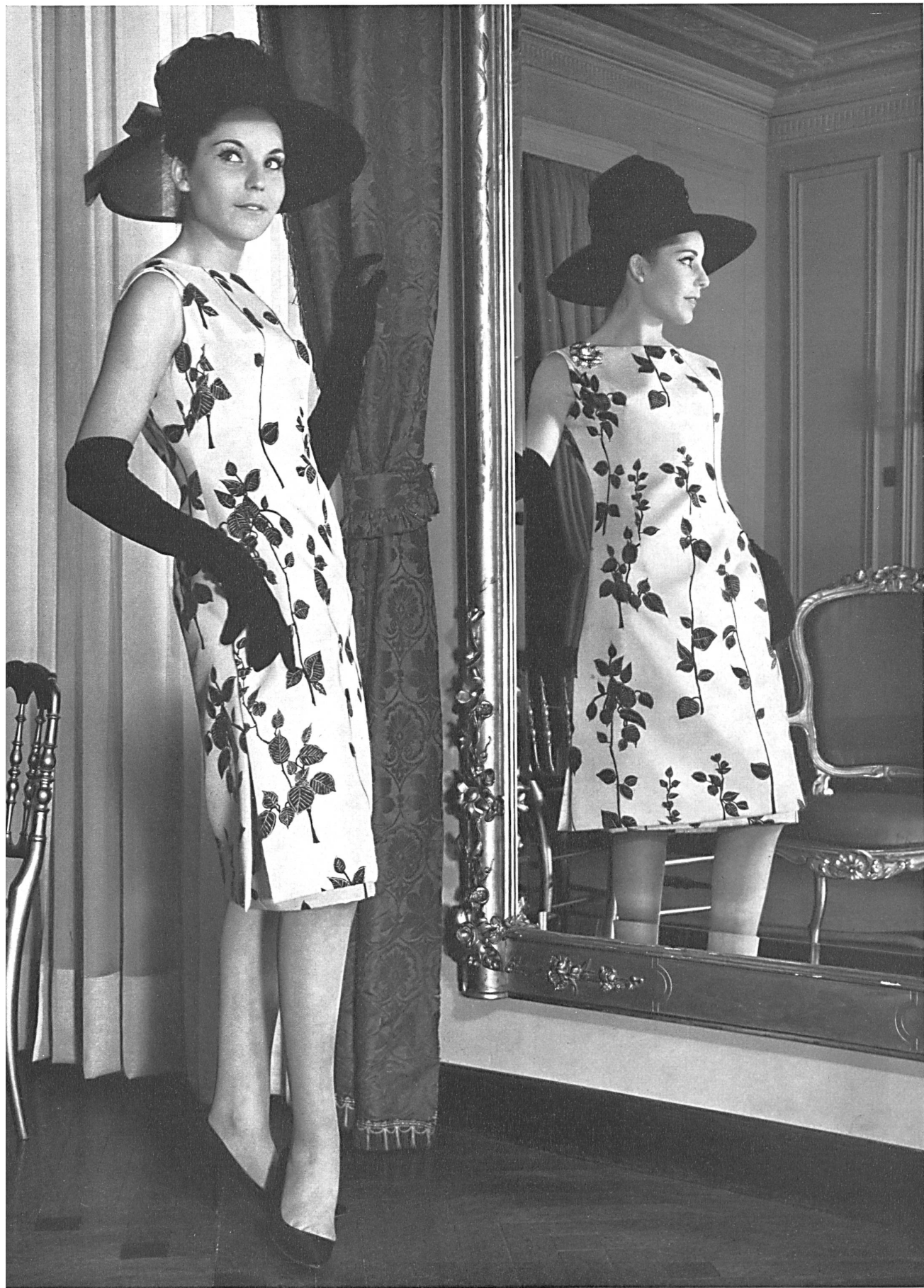
« rbc », RUDOLF BRAUCHBAR & CIE S. A., ZURICH « Amirante » — Tissu imprimé pure soie — Printed pure silk fabric — Tejido estampado de pura seda — Bedrucktes, reinseidenes Gewebe Modèle El Dique Flotante, Barcelone