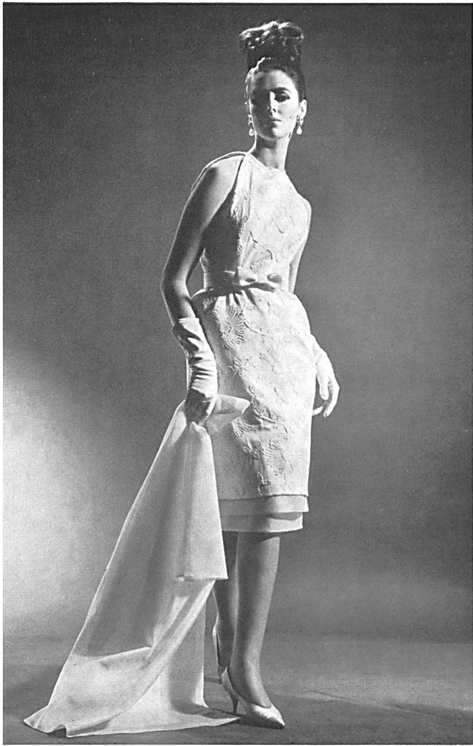
Shantung de coton brodé suisse Embroidered Swiss cotton Shantung Shantung de algodón bordado suizo Bestickter Schweizer Baumwoll-Shantung Modèle Jeanpalmério, Zurich