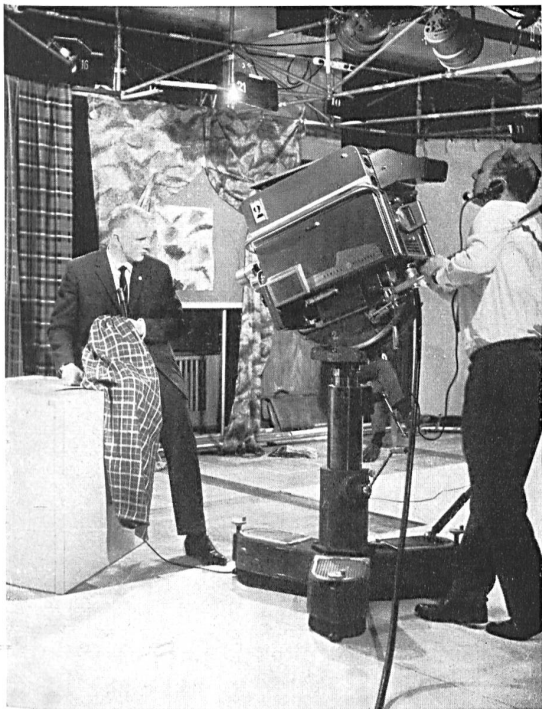
Prise d'un gros plan pour la retransmission par «Eidophore» Shooting a close-up for the «Eidophore» transmission Toma de un primer plano para ser retransmitido por el «Eidoforo» Nahaufnahme für «Eidophor»-Wiedergabe

The highlight of this year's event was the use of colour television on a big screen for part of the parade, with direct retransmission by means of the famous «Eidophore» apparatus. The Ciba chemical products factory