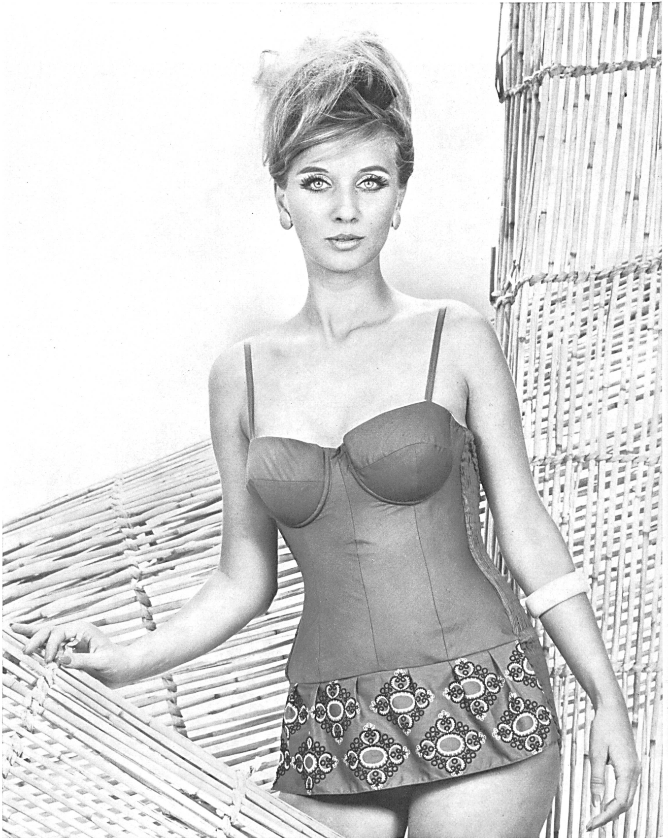
« RECO », REICHENBACH & CIE S. A., SAINT-GALL Popeline « Minicare » brodée / embroidered / bordado / bestickt Modèle Luigi Annovazzi, Milano