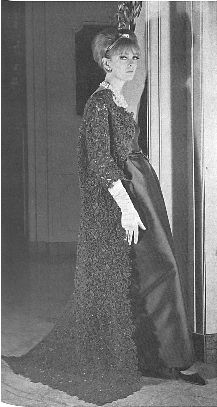
UNION S. A., SAINT-GALL Riche broderie guipure verte Rich green etched embroidery Rico encaje guipur verde Kostbare grüne Guipure-Stickerei Modèle Bicki, Milan