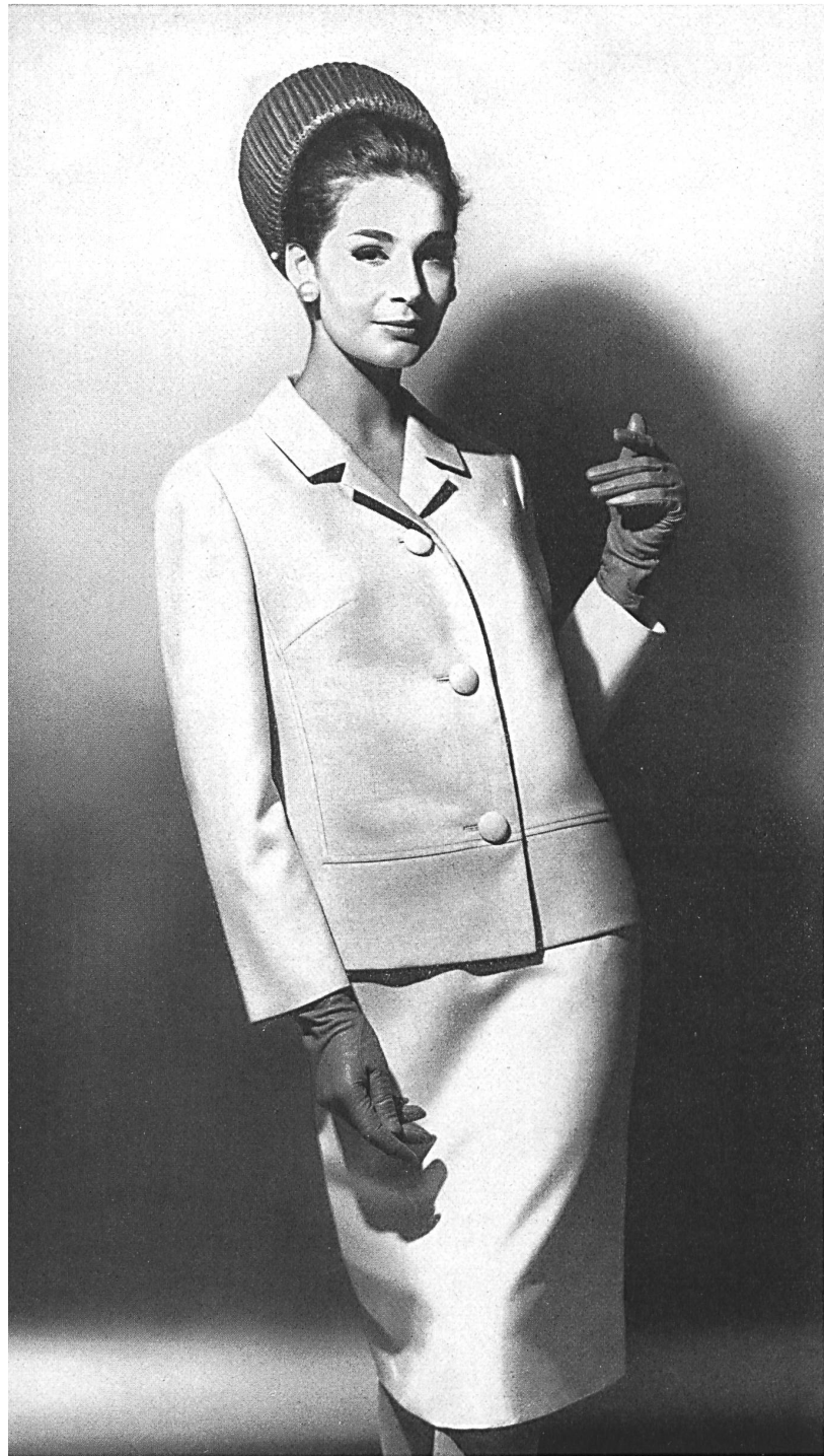
HEER & CIE S.A., THALWIL Fresco de « Terylène » et laine (« Téry- lène » and Wool / « Terileno » y lana / « Terylene » und Wolle) Modèle Paul Weibel A.G., Gossau