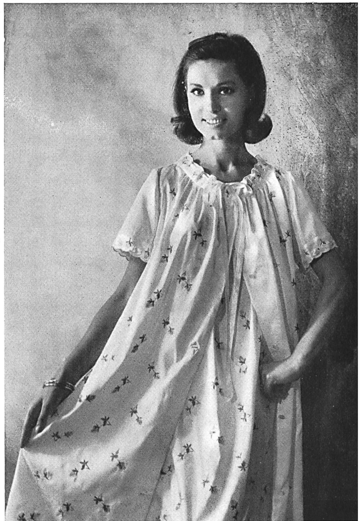
3. « ABC », ALEX BAUER & CO., SAINT-GALL Broderie multicolore Multicoloured embroidery Bordado multicolor Mehrfarbige Stickerei Modèles « Dubarry », Käte Schenkel-Eckert, Horn