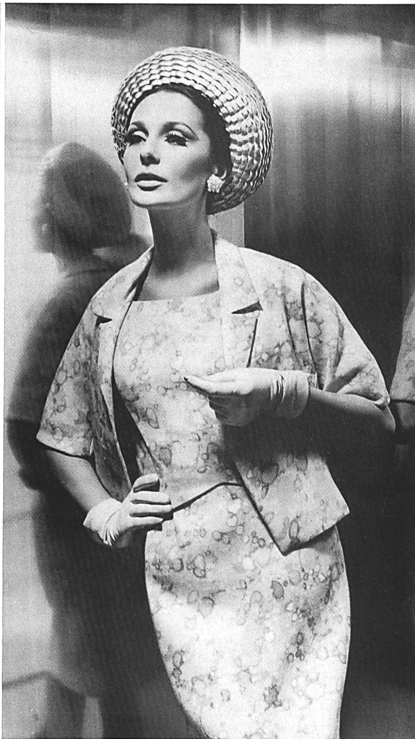
HEER & CIE S.A., THALWIL Fresco shantung imprimé (printed / estampado / bedrukt) Modèle Willy Meyer S.A., Zurich