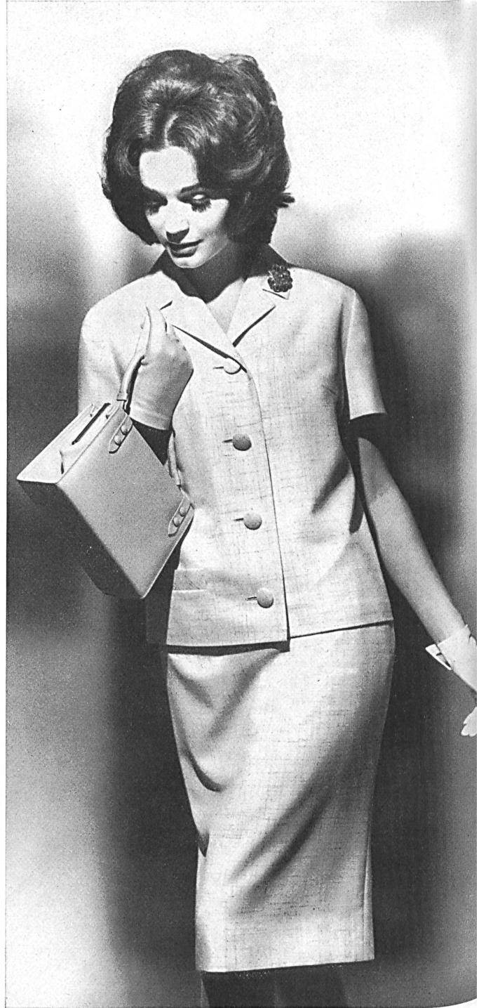
HEER & CIE S.A., THALWIL Shantung de « Terylène » et laine (« Tery- lene » and wool / « Terileno » y lana / « Terylene » und Wolle) Modèle Paul Weibel A.G., Gossau