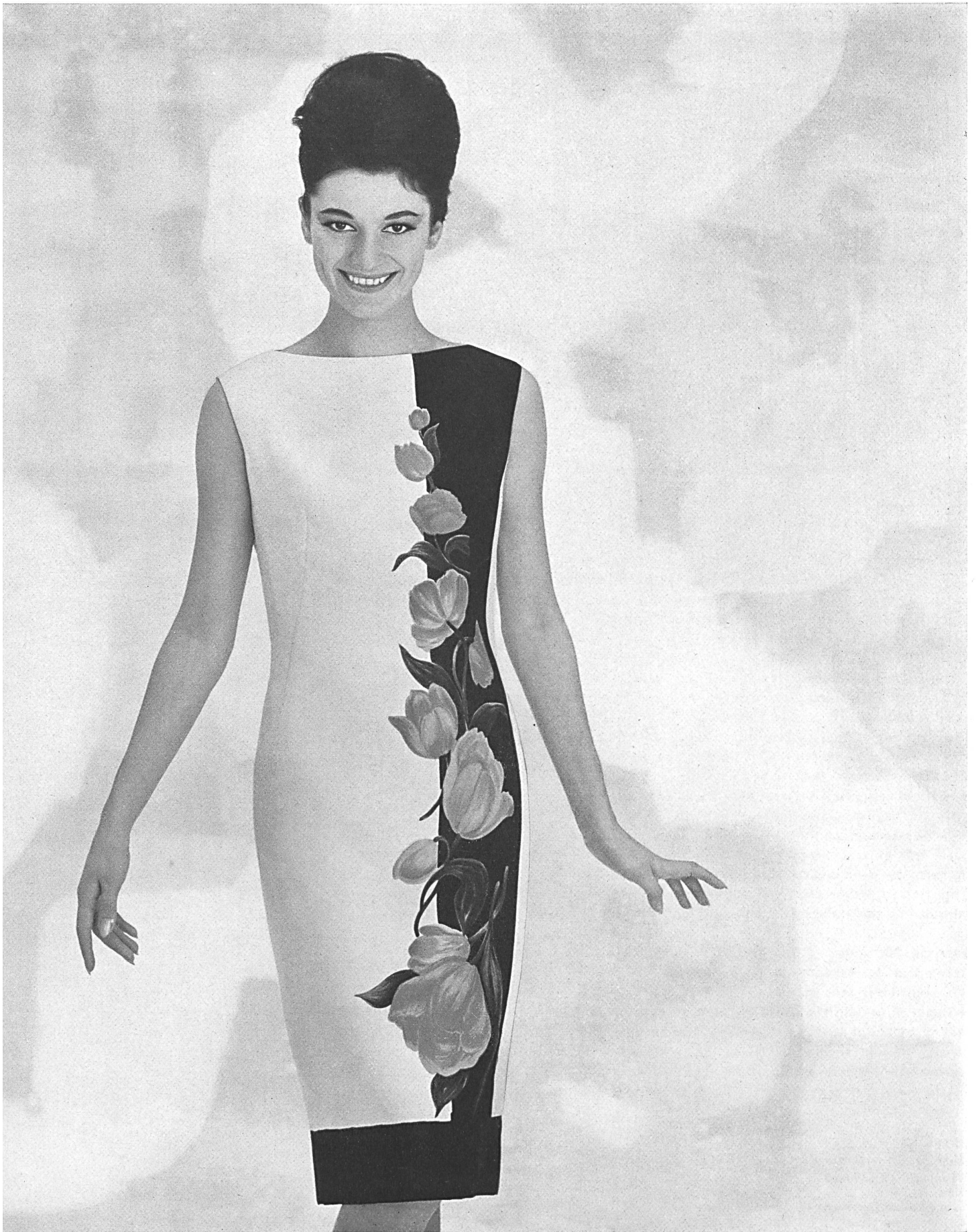
HEER & CIE S.A., THALWIL Panama de coton imprimé Printed basket weave cotton Panama de algodón estampado Baumwoll-Panama bedruckt Modèle Rena S.A., Zurich