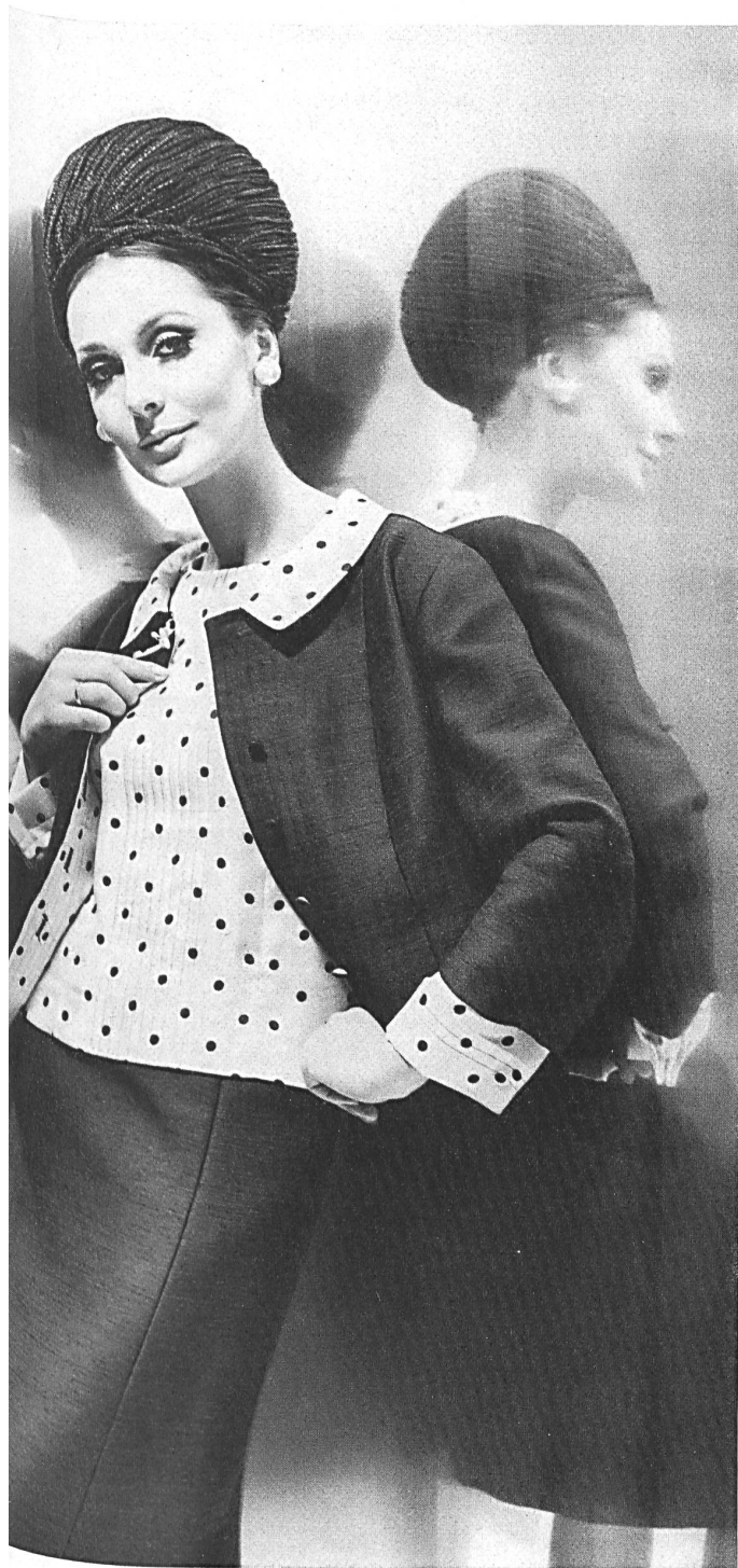
HEER & CIE S.A., THALWIL Shantung fibranne infroissable (crease resisting / inarrugable / knitterfrei) et twill imprimé (printed / estampado / bedrukt) Modèle Willy Meyer S.A., Zurich