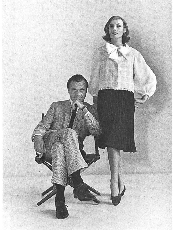
Swiss Fabric and Embroidery Center, New York

Bill Blass, of Maurice Rentner Ltd., the current return Coty Award winner, here shows one of his models, a three-piece suit featuring a pintucked sleeveless jacket frosted with Swiss guipure lace insets.