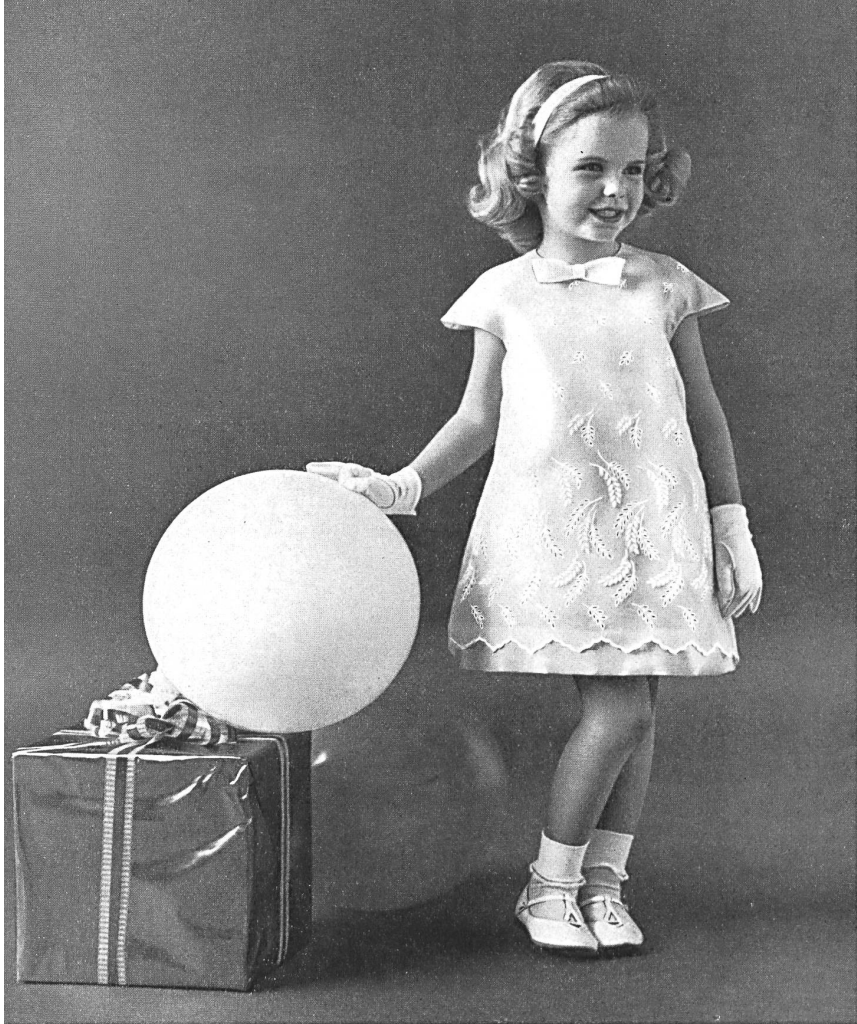
« NELO », J. G. NEF & CO. S. A., HÉRISAU Organdi blanc brodé White embroidered organdie Modèle de Youngland