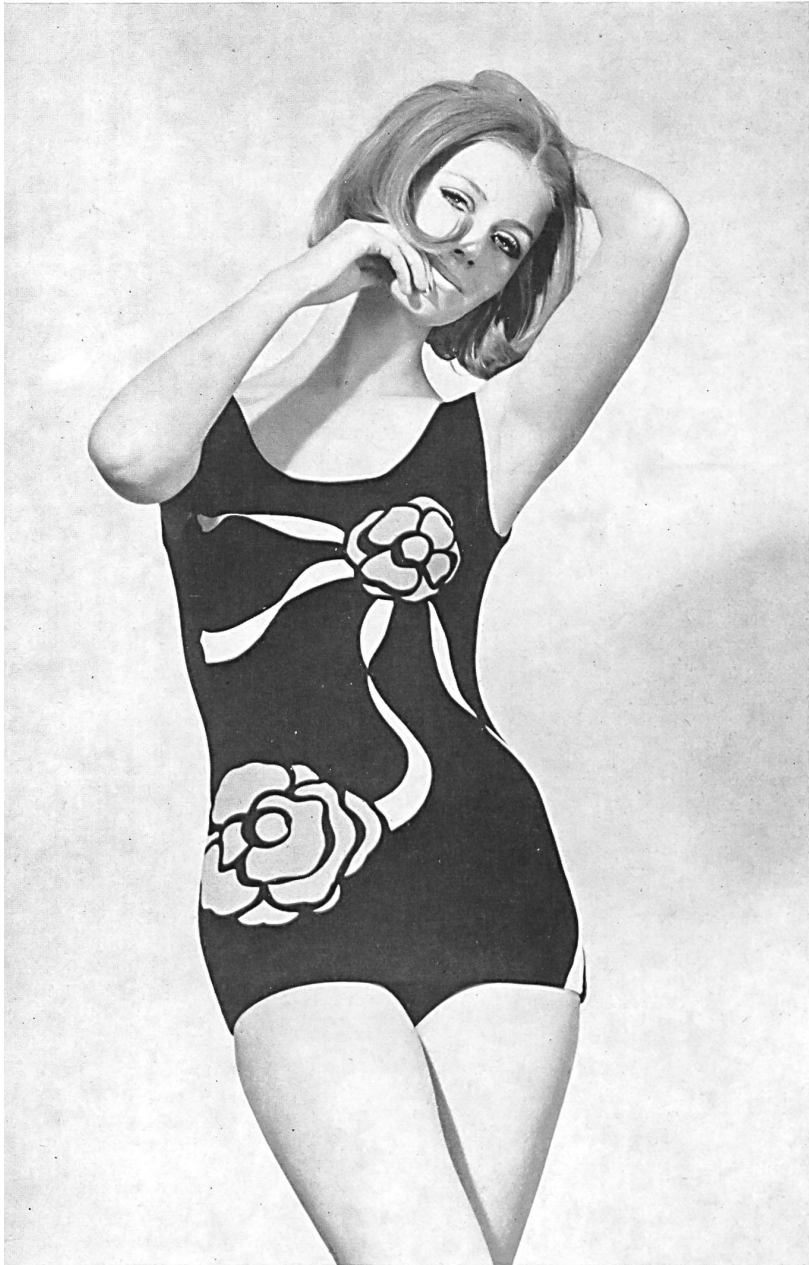
« ROBORO », J. F. ROHRER-BOLLIGER S.A., ROMANSHORN Maillot de bain en tricot « Helanca » avec dessin original imprimé « Helanca » swimsuit printed with an original design Bañador en « Helanca » con dibujo estampado original « Helanca » Badeanzug mit apartem Druckdessin