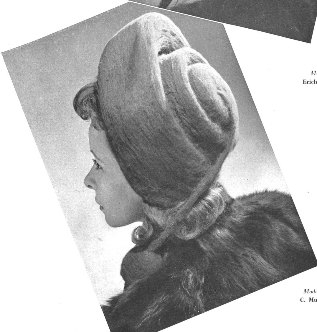
Modelo Modelo C. Muller S.A., Zurich.