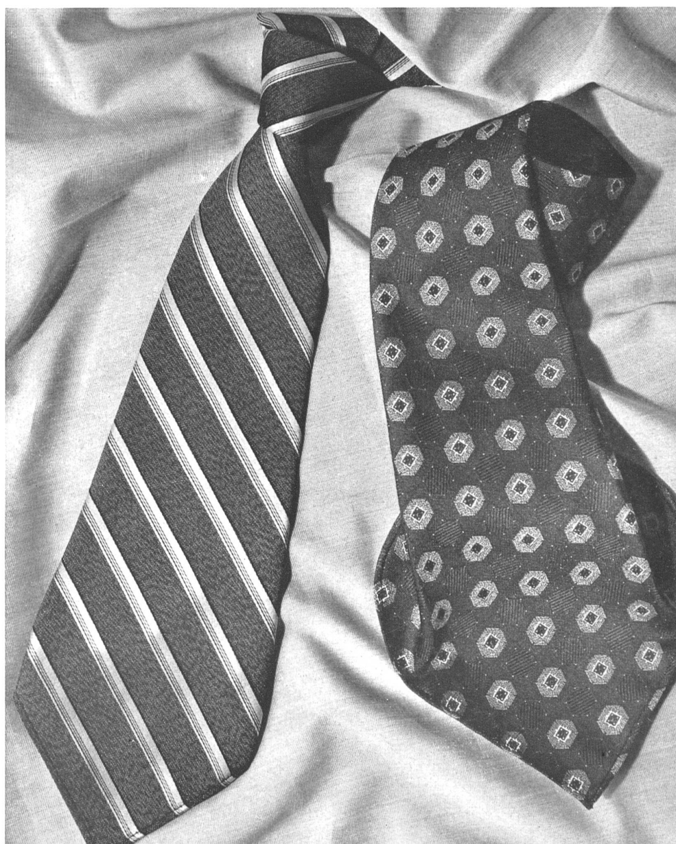
E. Vonwiller, Zurich.