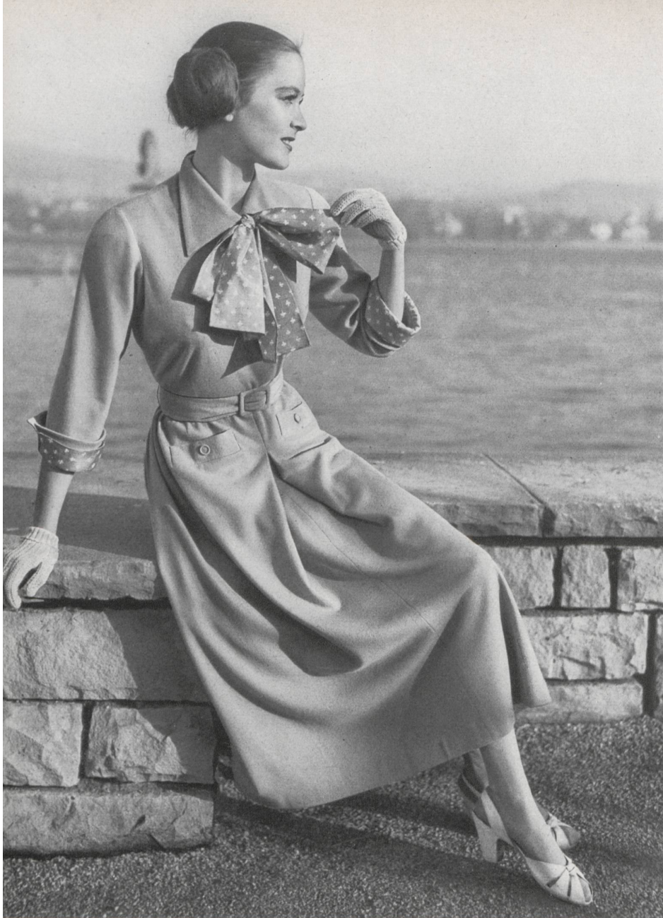
Vollmoeller, Uster Fabrique de bonneterie Uster.

Elegante trajecito primaveral, de punto de malla jersey, tonos de color delicados, con lazada y puños de tussor estampado en color apropiado.