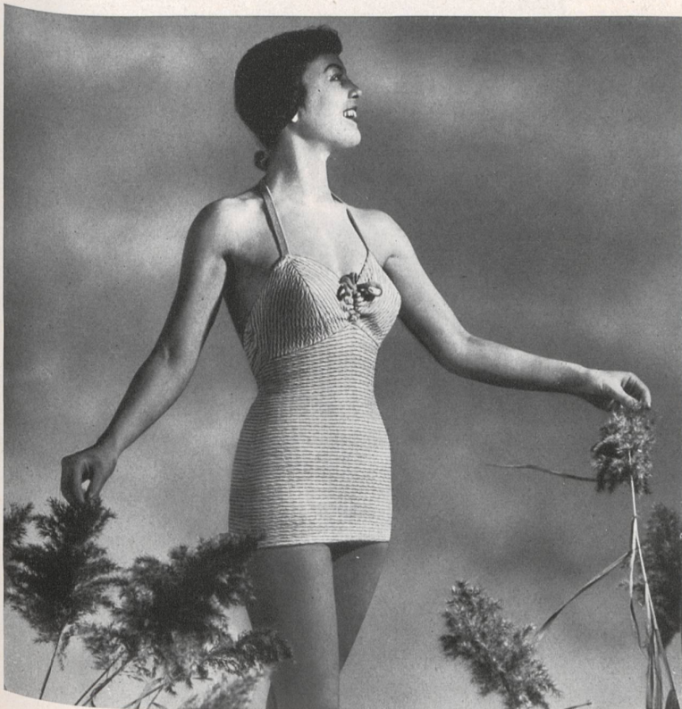
Nabholz S. A., fabrica de ropa de malla, Schönenwerd (Sol.).

Trajes de baño, vestidos y ropa interior de punto y de malla.