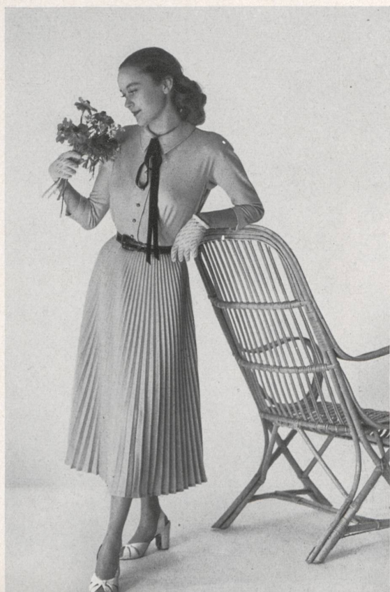
Vollmoeller, Uster Fabrique de bonneterie Uster.

Trajecito primaveral de punto de malla jersey, de aspecto muy juvenil, con hombros redondos, lazada de terciopelo negro, cinturón de charol y falda plisada.