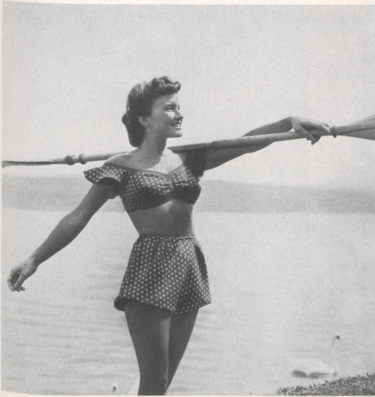
Société anonyme ci-devant W. Achnich & Cie, Winterthour.