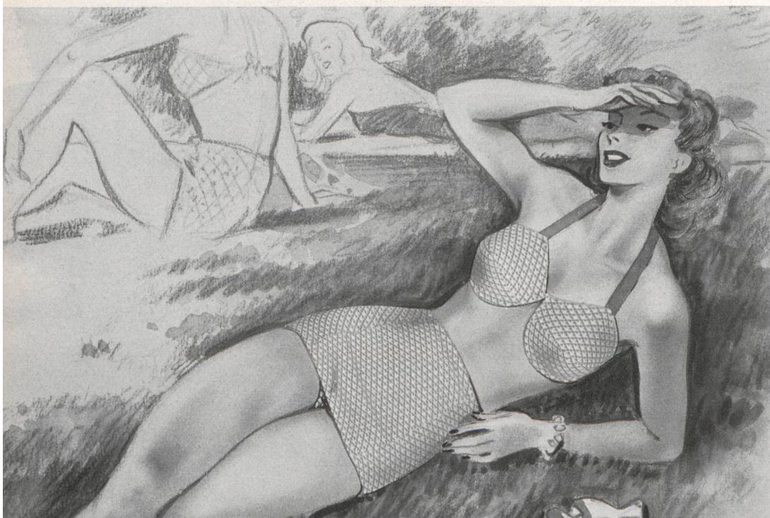
C. Burgi & Cie, Kreuzlingen.

Trajes de baño modernos, de hechura muy estudiada, para llevar con o sin falda.