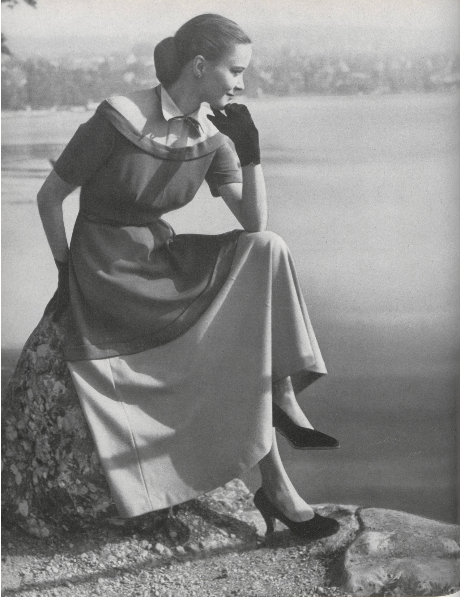
Nabholz S. A., fabrica de ropa de malla, Schönenwerd (Sol.).