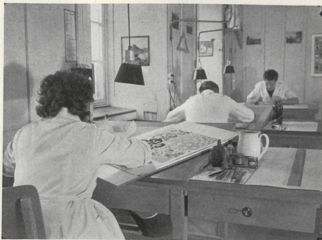
Taller de dibujo.

La estampación con estarcidos se lleva a cabo, en líneas generales, de la manera siguiente: La pieza de tejido se extiende y se fija sobre una mesa larga (de 40 a 80 metros) aplicándose sucesivamente y de un extremo al otro