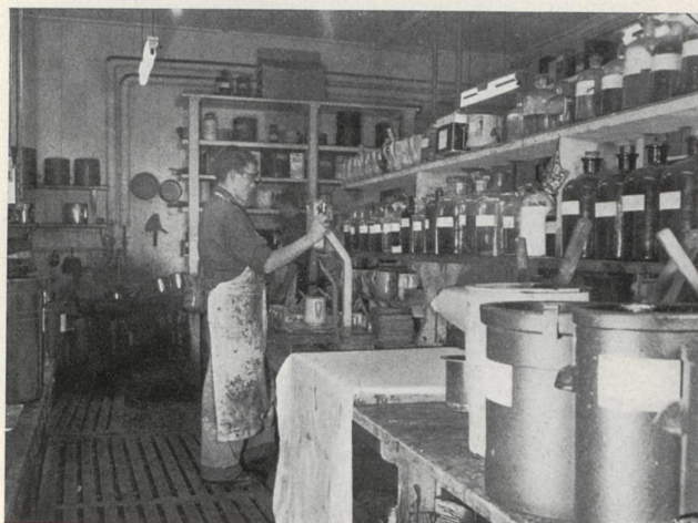
Preparación de las tintas.

mediante un estarcido, un reporte tras otro, todos los colores que componen el dibujo. Tiene que haber pues un estarcido por color; el estarcido está formado por una gasa de seda ultrafina, tensa en un marco. Mediante una operación fotoquímica se ciega con una película gelatinosa aquellas partes del estarcido que no deben dejar marca estampada, quedando libres los sitios que tienen que ser permeables al color; la tinta pasa fácilmente a través de las mallas de la gasa y penetra en las fibras del tejido cuando se la aplica sobre toda la superficie del estarcido,