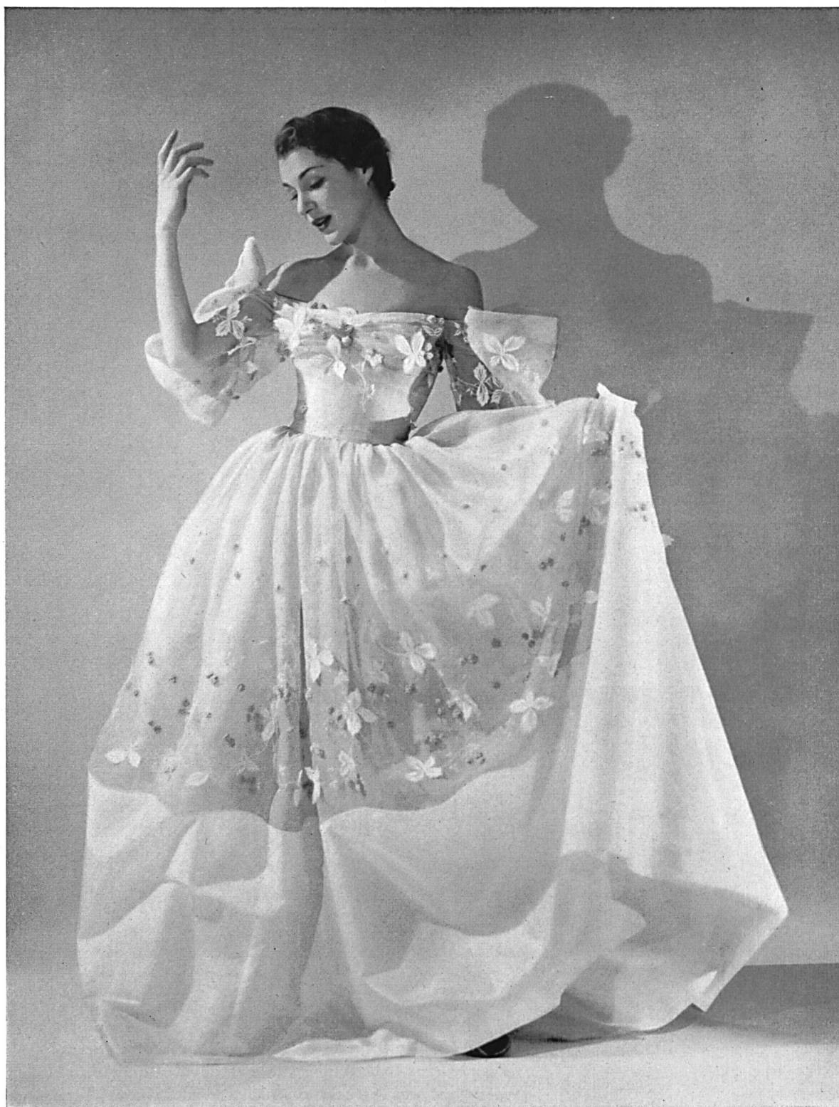
ADRIAN Blue Swiss organdy with white applied flowers and deep taf- feta hem.