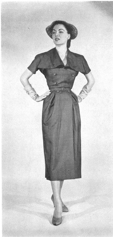
CHRISTIAN DIOR, NEW YORK Plain Super Miyako.