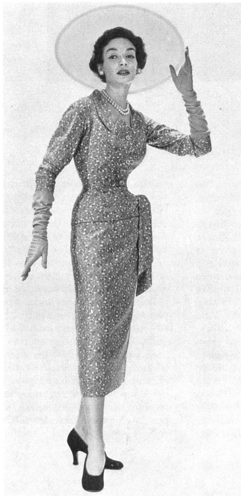
All fabrics are from L. Abraham & Cie, Soieries S. A., Zurich