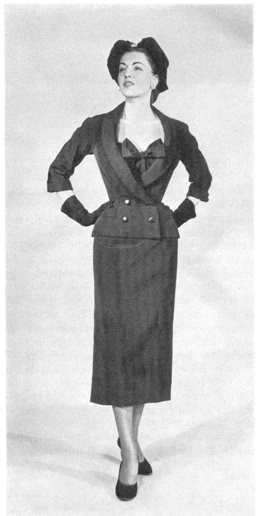
CHRISTIAN DIOR, NEW YORK Plain Amadis.