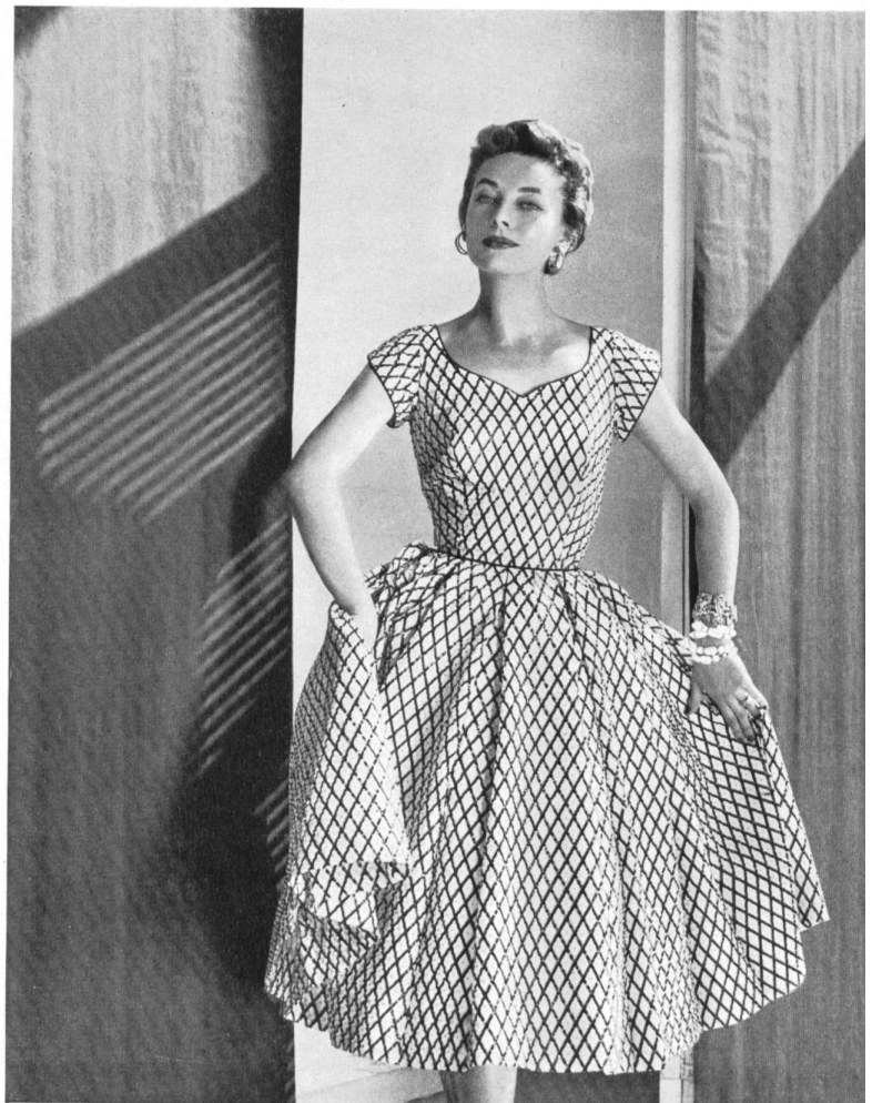
PAT PREMO A Plastoprint cotton fabric by Stoffel & Co., St-Gall.