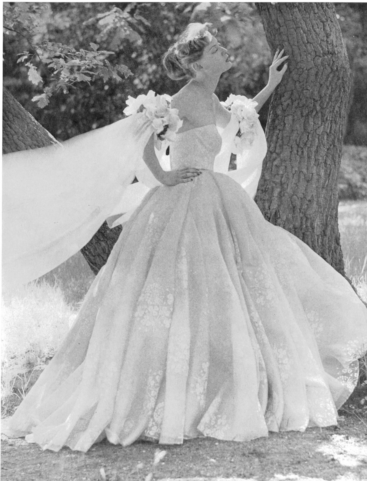
SERGE KOGAN Tissu « Flockprint » de Union S. A., St-Gall ; grossiste à Paris : Pierre Brivet S. à r. l.

Nous pensons intéresser nos lecteurs de l'hémisphère austral en reproduisant ici quelques modèles de collections de cette année précédant celle de l'hiver 1953-1954.