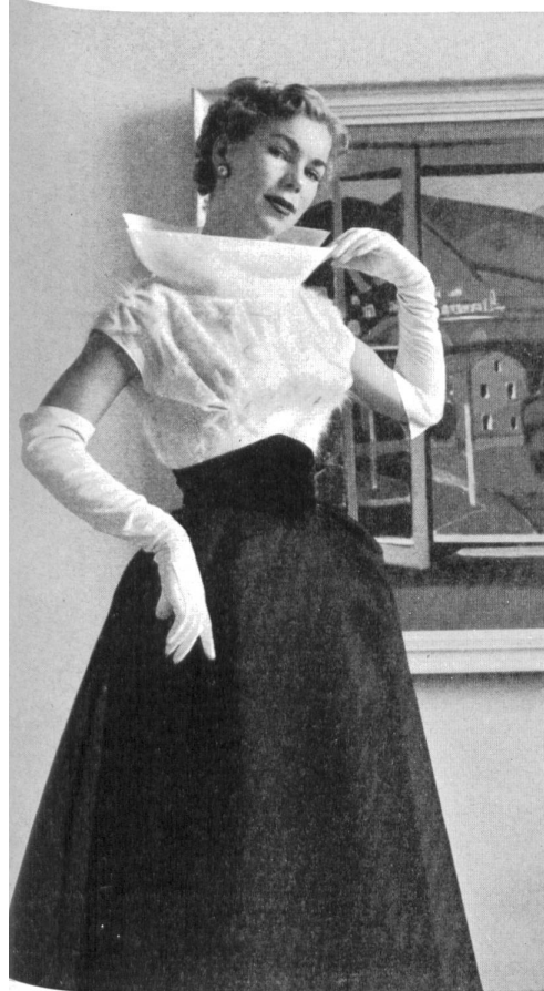
HENSEL & MORTENSEN, BERLIN Fil à fil Directoire knitterfrei von Heer & Co. A.-G., Thalwil.