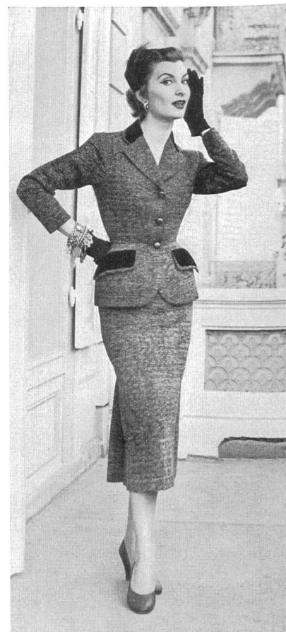
NICOL MODELLER A.-B., GÖTEBORG Chenilles fantaisie de Rudolf Brauchbar & Cie, Zurich.

bordados o de tela de seda y de algodón. Las exportaciones de productos textiles suizos a Suecia presentan actualmente un aspecto favorable debido a las medidas de liberalización adoptadas por Suecia como consecuencia de las recomendaciones hechas por la Organización Europea de Cooperación Económica. Las cifras indicadas a continuación (en millares de francos suizos) se refieren al primer semestre de 1953 y darán una idea del progreso realizado si se los compara con las correspondientes al mismo período del año próximo pasado que van indicadas entre paréntesis :