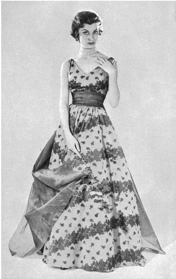
NICOL MODELLER A.-B., GÖTEBORG Organza broché de Rudolf Brauchbar & Cie, Zurich.

Suiza es, también para Suecia, un importante proveedor de productos textiles y para vestir. Lo mismo que los habitantes de muchos otros países nortños, los suecos, además de ser sensibles a la elegancia, también saben apreciar mercedamente la calidad; y, en cuanto a la calidad, saben que la han de encontrar en los productos suizos, trátese de ropa hecha, de prendas de punto, de