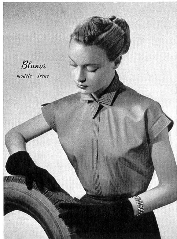
Modell Irène : Sportliche Bluse aus Knitterfreiem Baumwollpopeline.