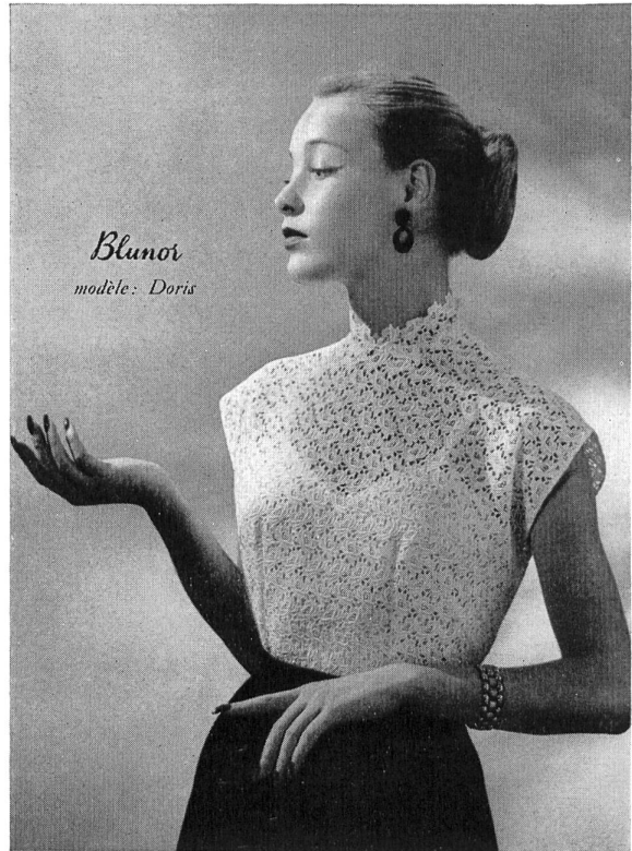
Modell Doris : Elegante Bluse aus Aetz-Guipure.