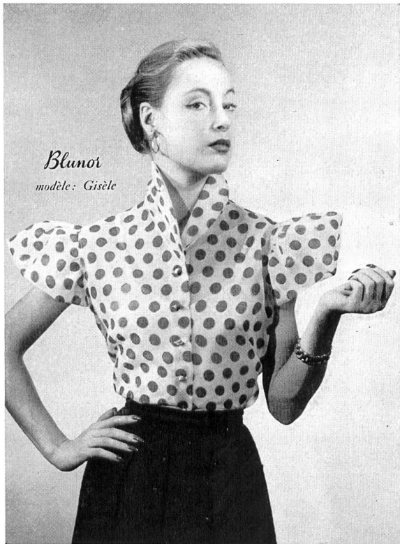
Modell Gisèle : Bluse aus Nylon-Organza, weiss mit Tupfen.