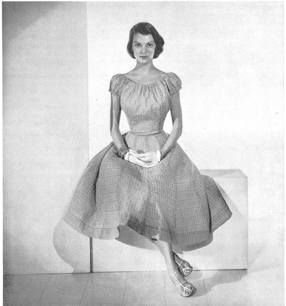
Little-girl dress in anti-creased and sanforized cotton voile, Pat Premo's exclusive fabric by Stoffel & Co., St-Gall.

« Ningún otro vestido podría convenir mejor a una señora. » En estos términos calificó una de las compradoras de uno de los almacenes especiales del ramo al vestido de verano, de algodón, que le acababan de presentar y que era uno de los últimos modelos de Pat Premo. Y esa frase