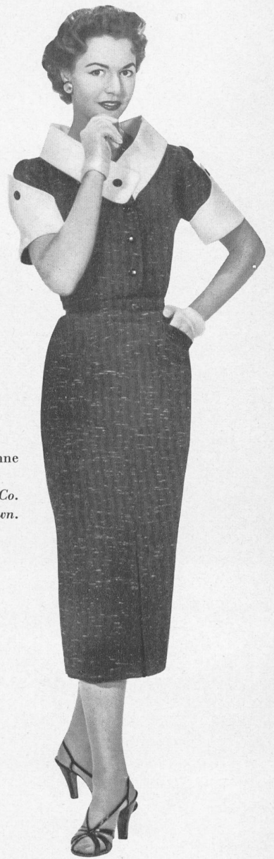
Toile Haruko, rayonne et fibranne. Modèle Hellas Mfg. Co. (Pty) Ltd., Cape Town.