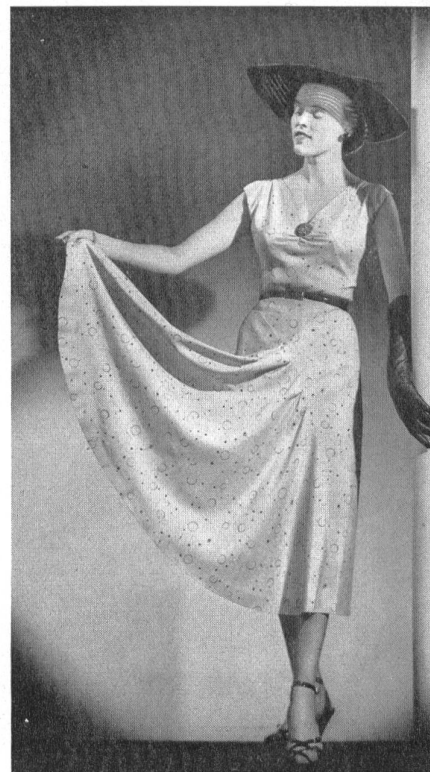
Kiang-Su imprimé. Modèle M. K. Manufacturers Ltd., Auckland.