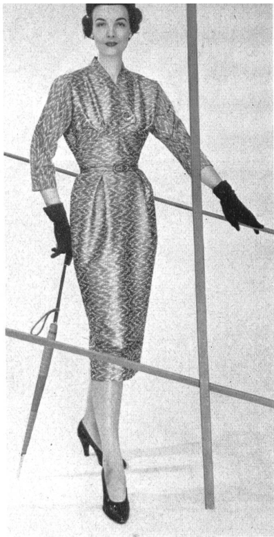
Marrakech façonné. Modèle Halldéns, Stockholm.