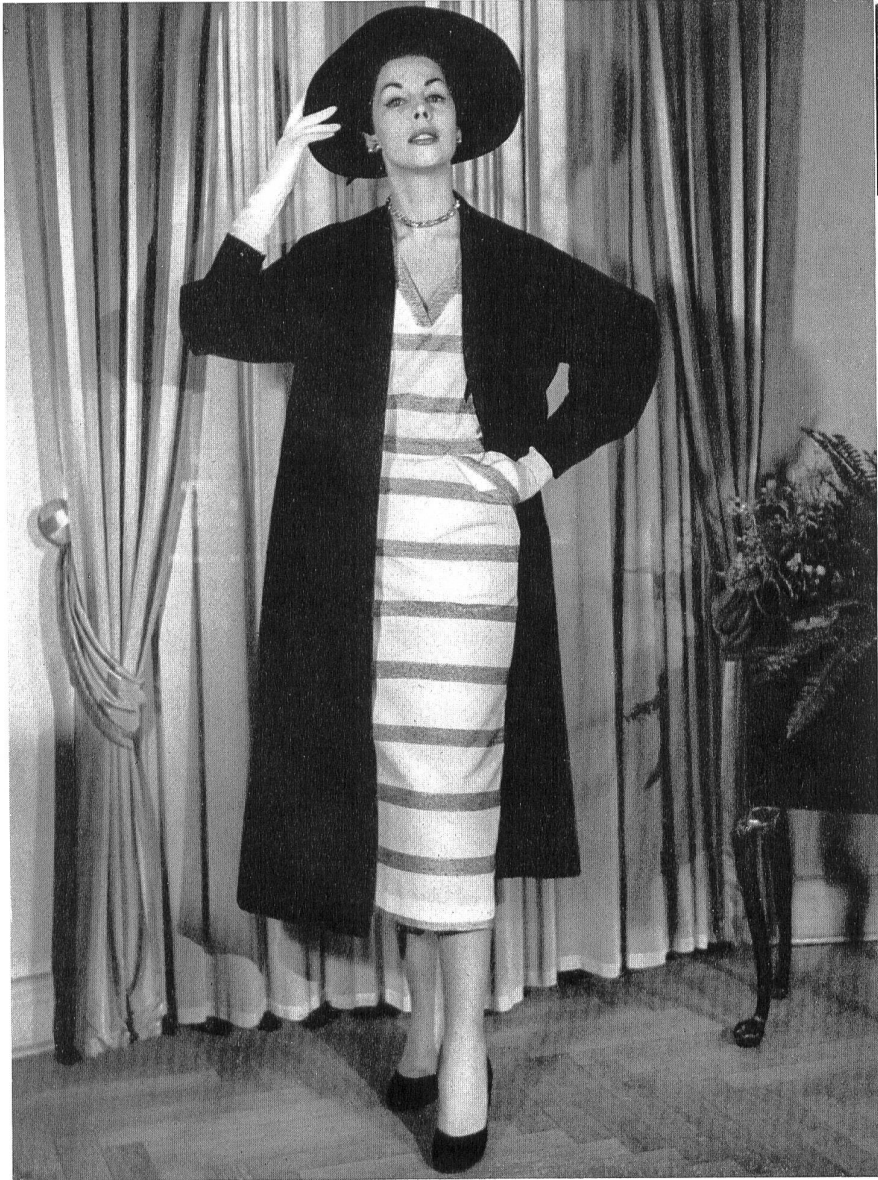
Bouclé Sport, 100 % rayonne. Modèle Bengtsons Konfektions A. B., Stockholm.