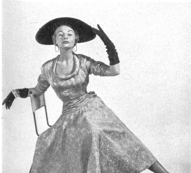
Matelassé façonné. Modèle Hartnell Garment Co., Melbourne.