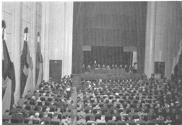
El gran anfiteatro del Centro Marcelin-Berthelot durante la sesión de inauguración (Conferencia del profesor Staudinger).