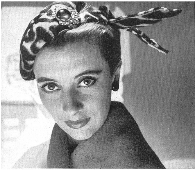
Modelo suizo