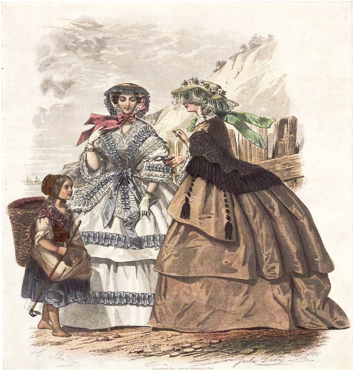
La cinta en la moda femenina de hace un siglo (según grabados de la época).

Los fabricantes cumplen la difícil tarea de dirigir una producción que ha de renovarse incesantemente para seguir la evolución de la moda y las costumbres de los