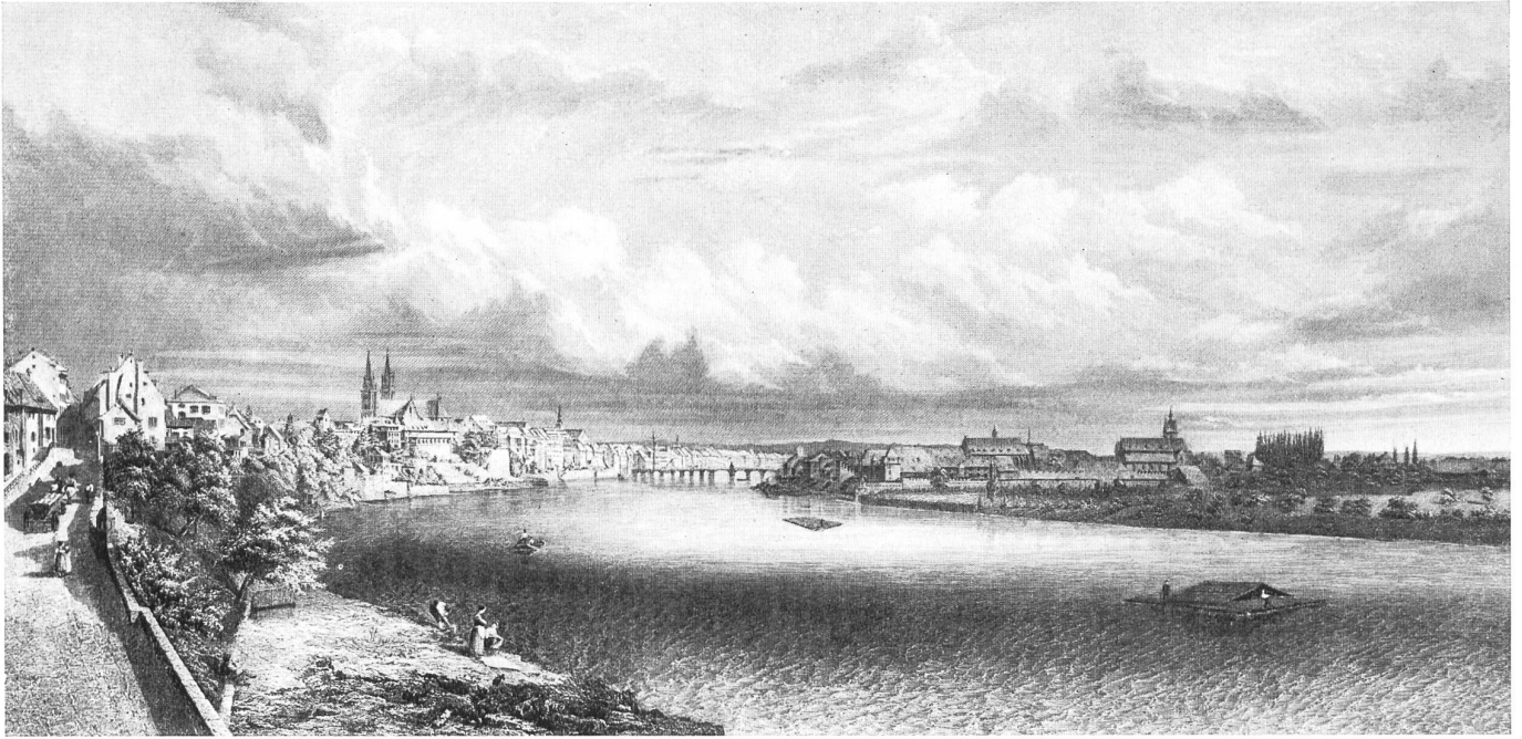
Basilea, hace un siglo (según un grabado de la época).