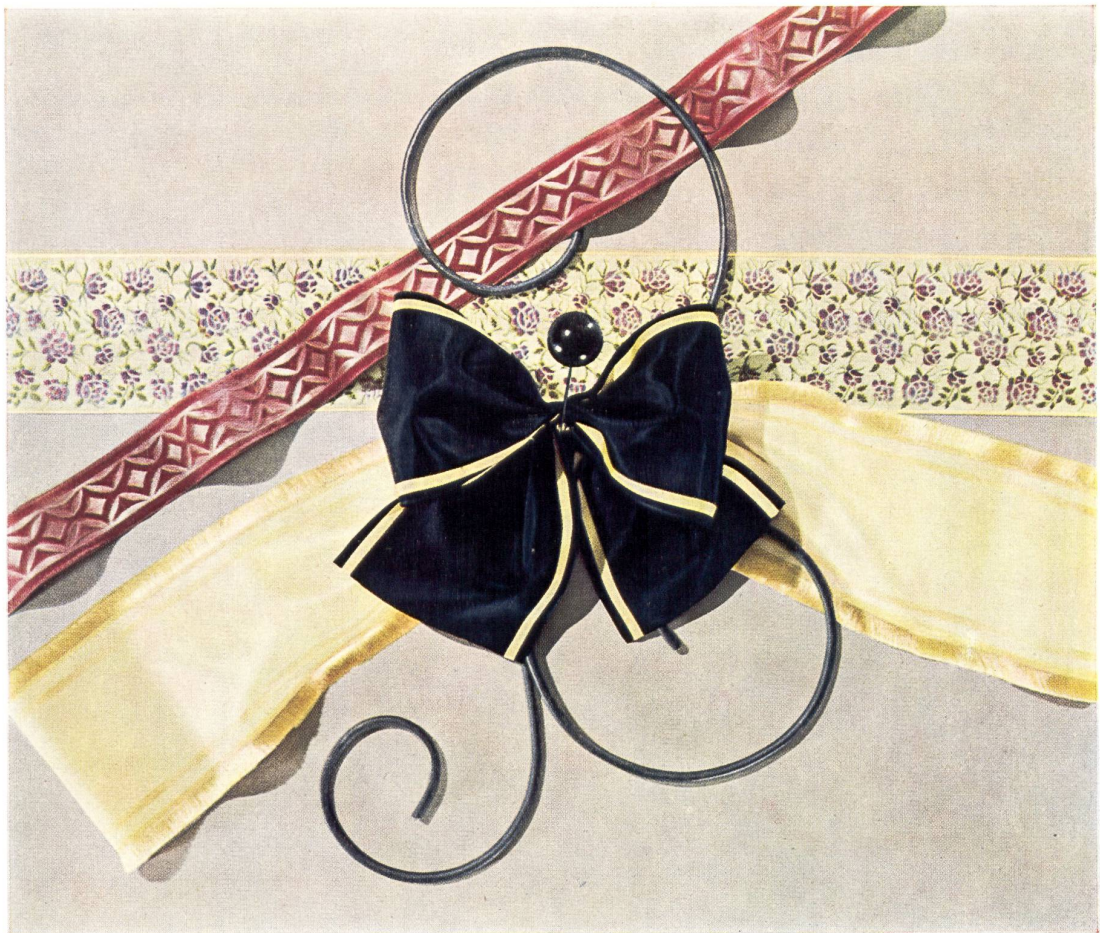
Cintas modernas de Basilea, distintos modelos.