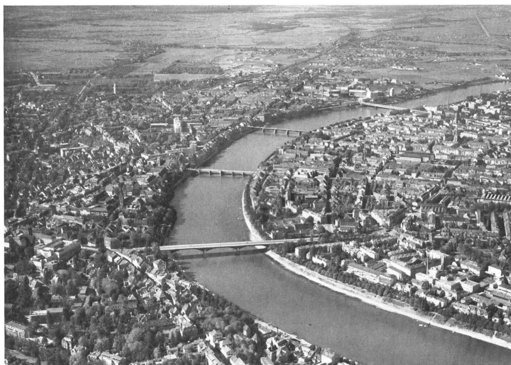
Basilea vista desde avión. A la izquierda el casco de la ciudad antigua, a orillas del Reno, entre los dos primeros puentes.