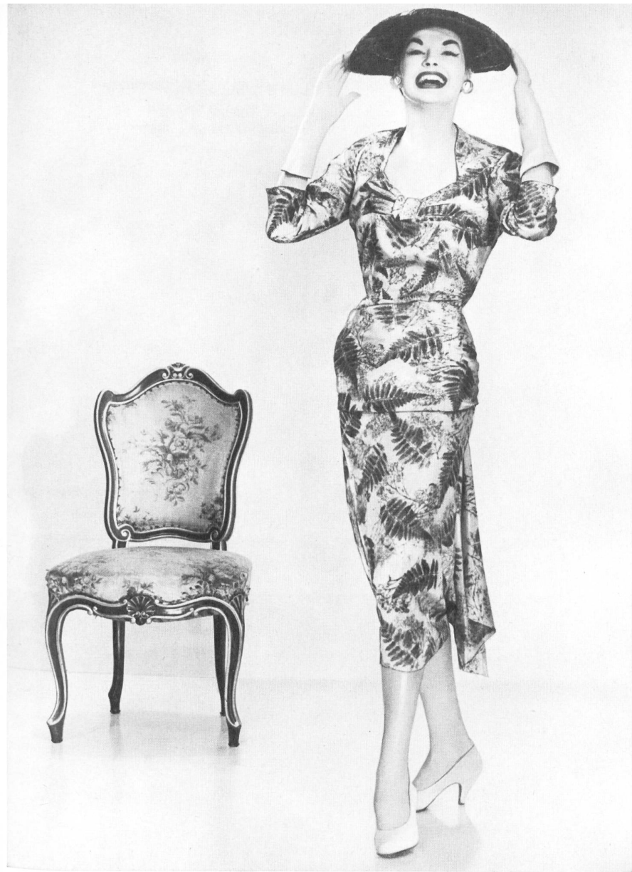
Gerson L. Dreese N.V., Amsterdam Toile magique pure soie de Emar S. A., Zurich