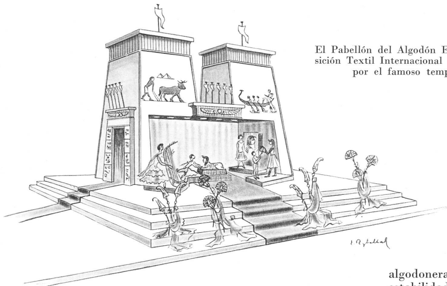
El Pabellón del Algodón Egipcio en la II. a Exposición Textil Internacional de Bruselas, inspirado por el famoso templo de Karnak.

Por paradójico que parezca, se encontrará también tejidos suizos en un pabellón egipcio. (Palacio 6 Stand 6501/6600). En efecto, el Comité de Propaganda para el Algodón Egipcio ha erigido un stand que representa el templo de Karnak (véase arriba) que estará reservado a los industriales europeos para que puedan presentar sus mejores productos fabricados con algodón egipcio.