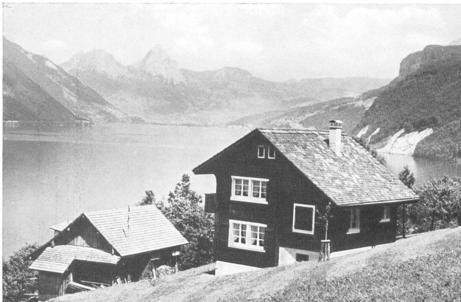
Una de las casas de reposo para los empleados, en Beckenried cerca de Lucerna.

La obra conmemorativa de la Hilatura del Lorze debe quedar reseñada como un modelo de su clase. Al disponer de una documentación abundante y completa, el autor supo sacar provecho muy competentemente y, al mismo tiempo que reseña el historial de una empresa, ha logrado escribir un capítulo en el que estudia muy a fondo el desarrollo industrial y económico suizo durante los últimos cien años transcurridos.