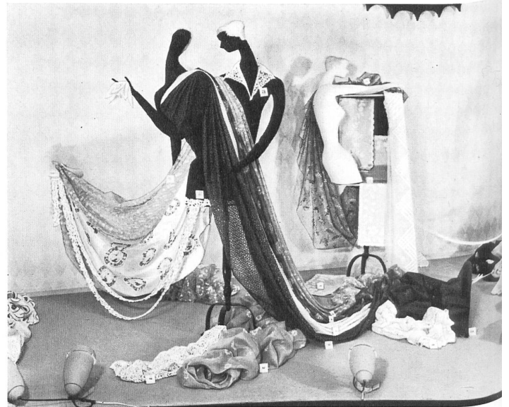
Bordados y tejidos finos de algodón de San-Gall.

La « Semana Suiza » de Estocolmo ha constituido un éxito. Esperemos que contribuirá duraderamente a desarrollar las relaciones comerciales sueco-suizas, como fué expresado por todos los participantes.