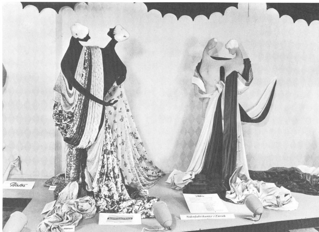
Un aspecto de la exposición de la industria de la seda.