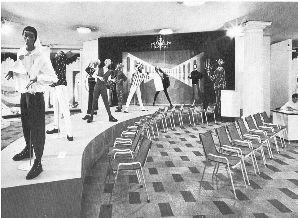
Vestidos de deporte.