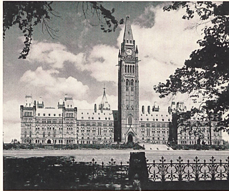
Ottawa : Cuerpo central del palacio del parlamento canadiense, con la Torre de la Paz.

En el Canadá, es frecuente oír a la clientela quejarse de que no se encuentran los mismos artículos en todos los almacenes. A ello se debe el que la casa Morgan haya realizado un esfuerzo especial para ofrecer mercancías que no pueden ser obtenidas en otras partes y, para ello,