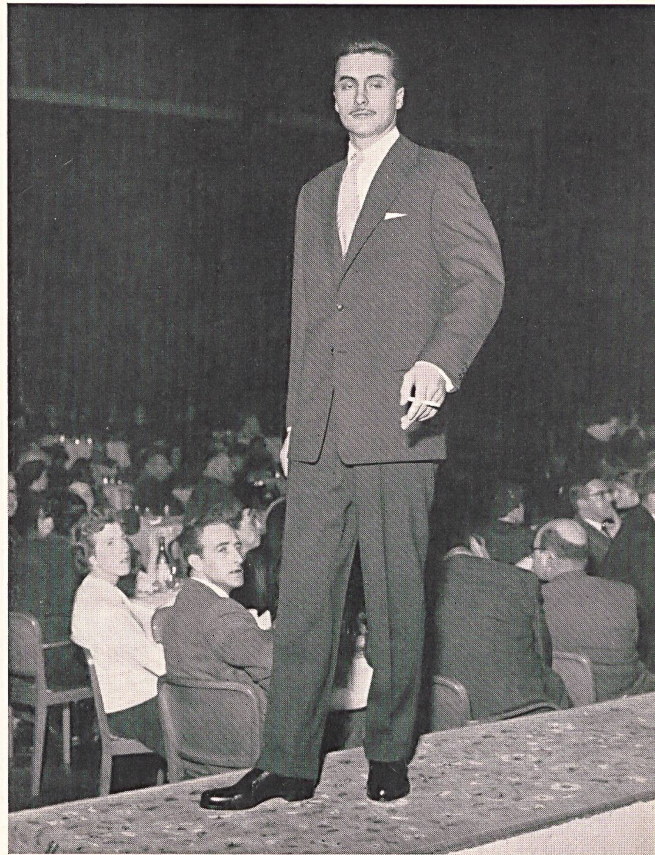
Complet peigné aubergine. Aubergine-coloured worsted suit. Terno de estambre color berengena. Kammgarnanzug Aubergine-farbig.