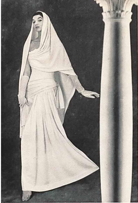
Vestido de gala, de malla jersey de lana blanca