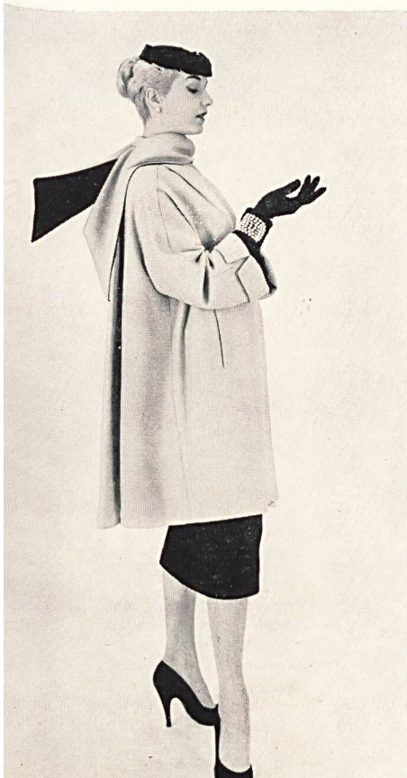
Abrigo de 7/8, de paño color tramilla