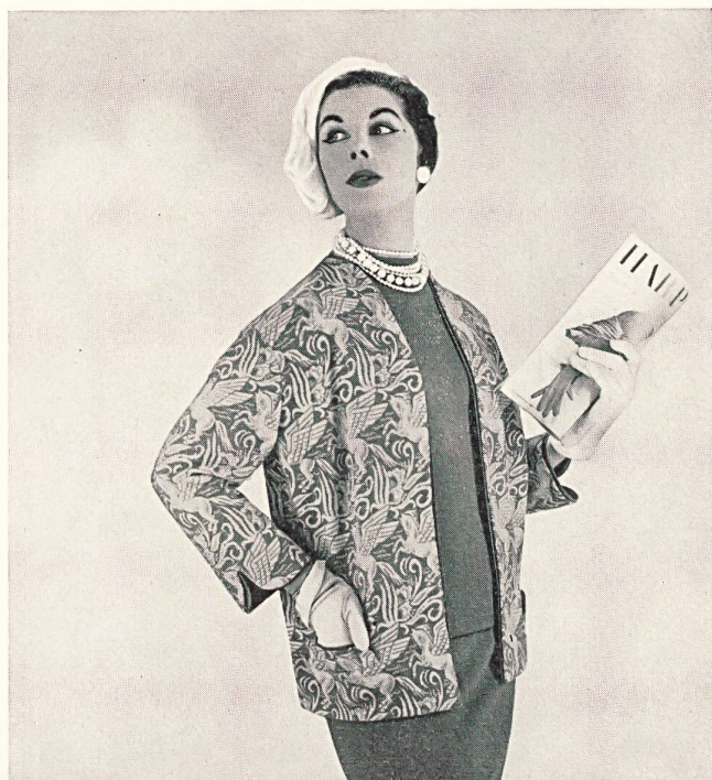
Conjunto de tres piezas, de punto wevenit-jacquard