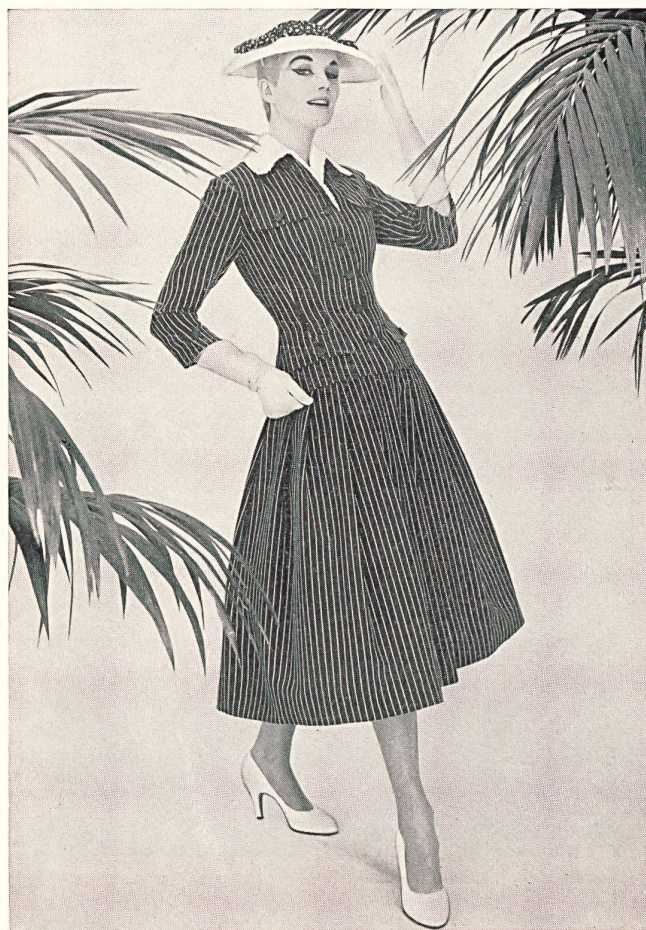
Conjunto de vestido y chaqueta de « fresco » azul y blanco

Durante la manifestación mencionada, se daba una cuenta de ello al examinar las exhibiciones de tejidos de lana dispuestos con arte y durante el desfile. La Secretaría Internacional de la Lana recurrió con este motivo a la colaboración de la Asociación Suiza de la Industria