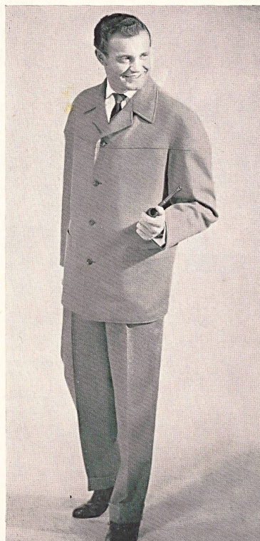
Complet Glencheck, coupe Anatomic. Glen check suit. Anatomic cut. Terno Glencheck, hechura Anatomic. Glencheck-Anzug mit Anatomic-Schnitt.