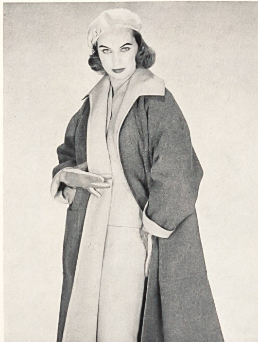
Traje sastre, de lana fantasía ; abrigo de viaje reversible tweed y gardina