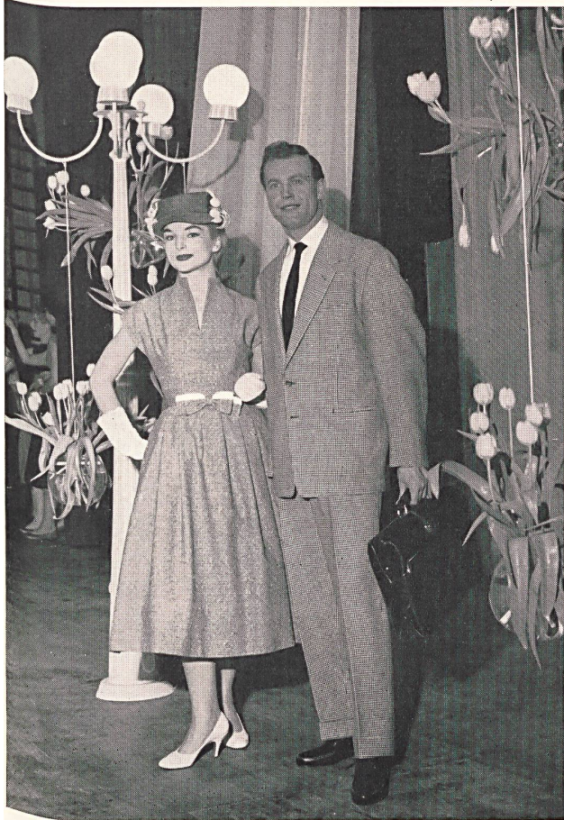
Complet pied de poule en laine d'agneau. Continental-Style. Houndstooth suit in lamb's wool. Continental-Style. Terno pie de gallo, de lana de cordero. Estilo « Continental ». Anzug mit Gänsefussmuster aus Lammwolle. Continental-Style.