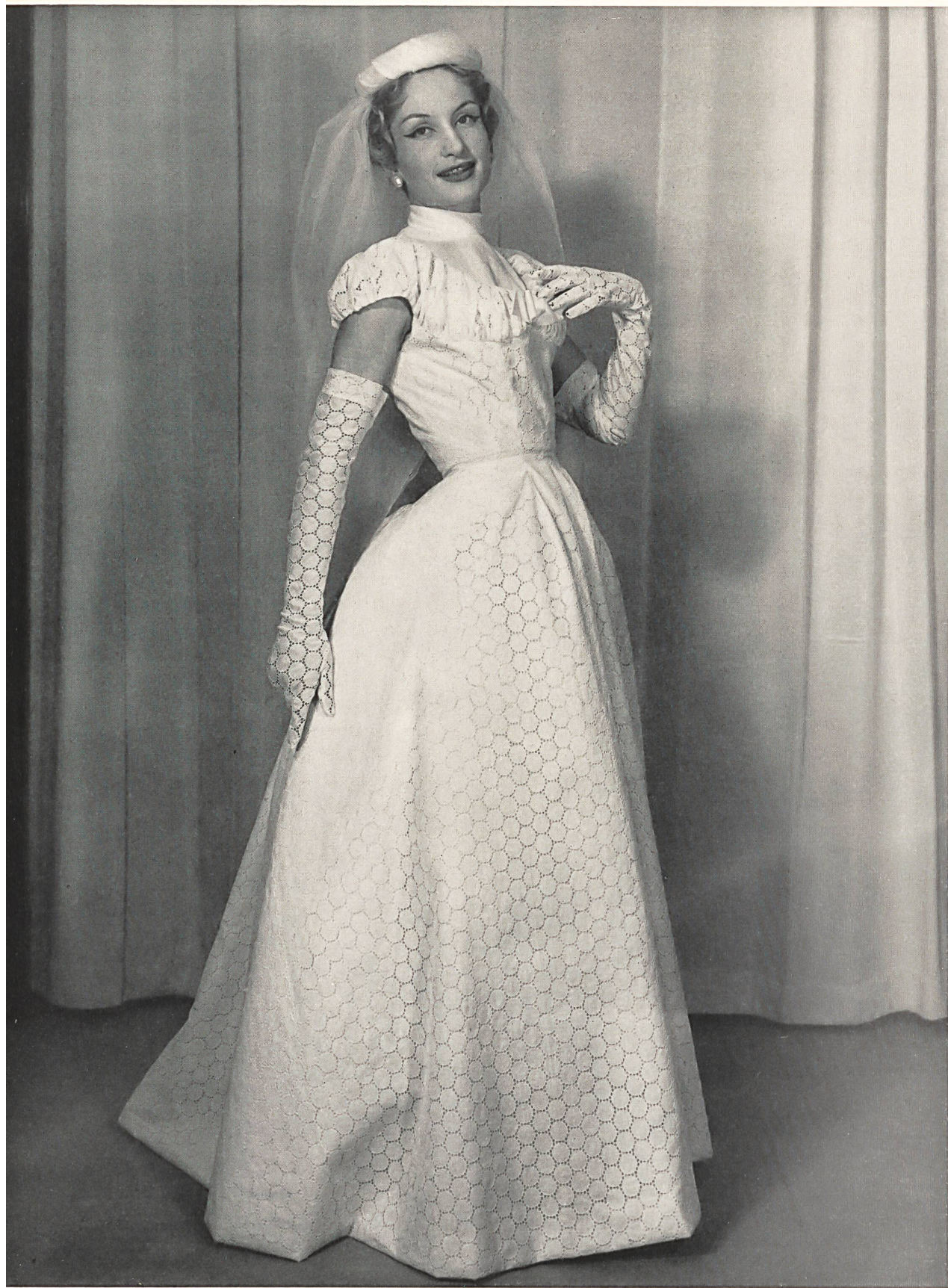
CHARLES MONTAIGNE Batiste brodée de Reichenbach & Co., Saint-Gall Montex, Paris