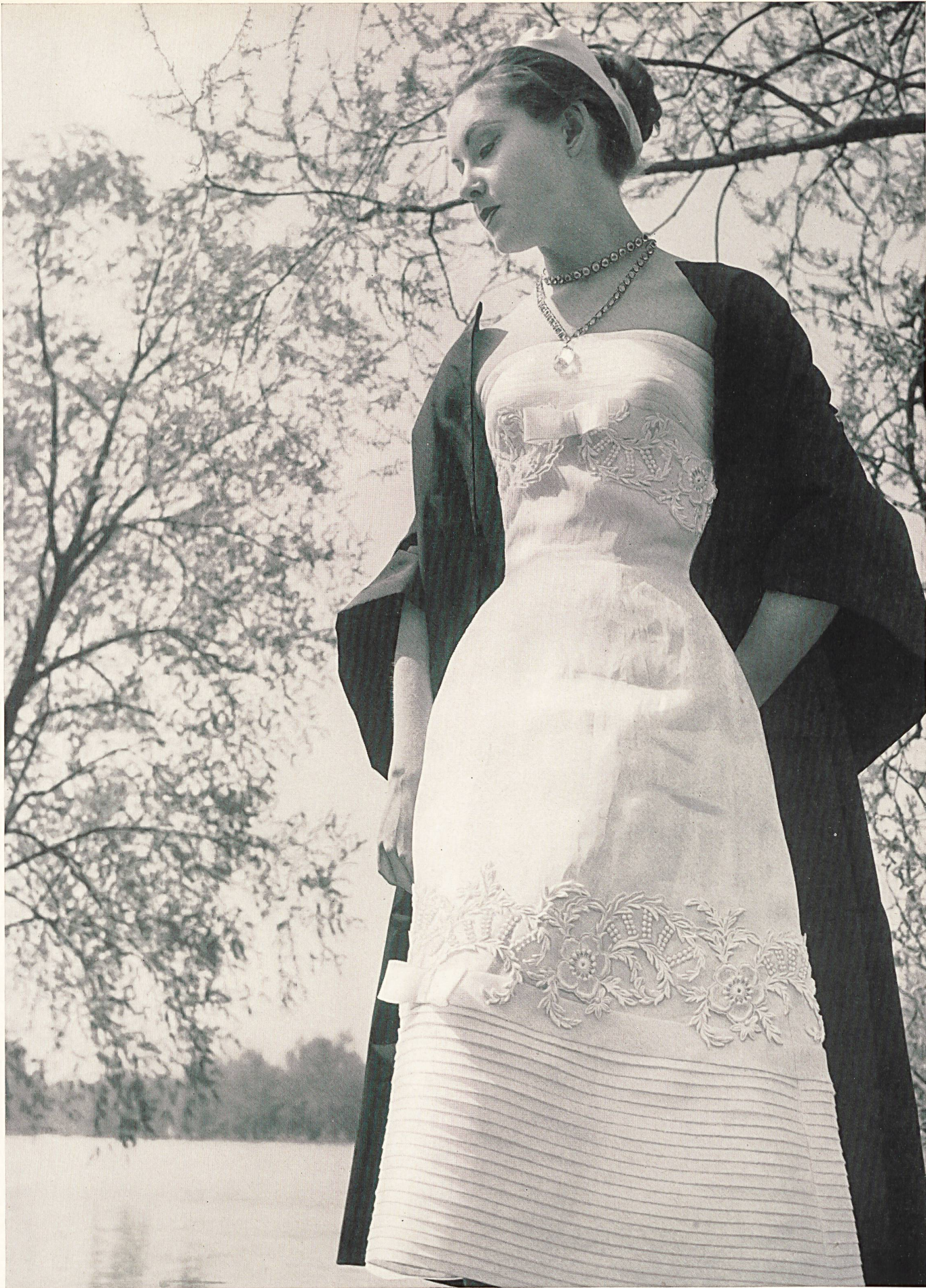
JEAN PATOU Organdi blanc avec guipure de Forster Willi & Co., Saint-Gall Grossiste à Paris: Chatillon, Mouly, Roussel S.A.