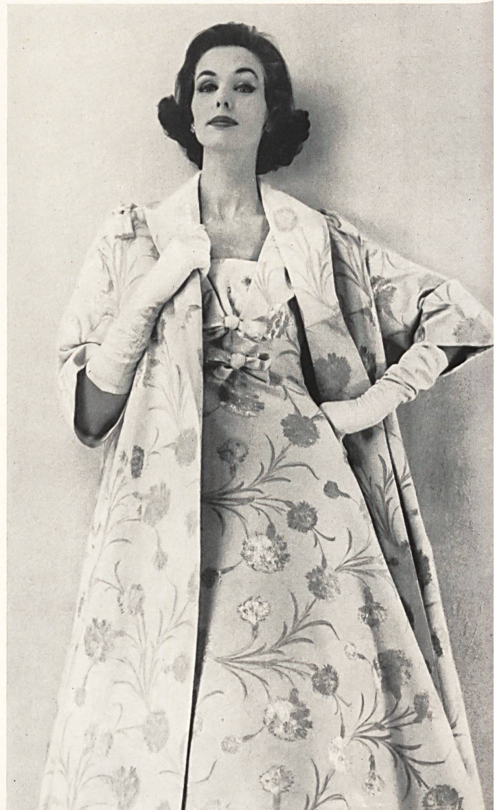
BALENCIAGA Photo Kublin