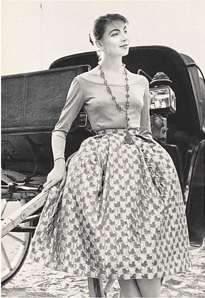
CHRISTIAN DIOR (Boutique) Broderie coton et or sur Satin Duchesse de Walter Schrank & Co., Saint-Gall Grossiste à Paris: Chatillon, Mouly, Roussel S. A.

Tous les documents de Paris reproduits dans ce numéro représentent des modèles réservés dont la reproduction est interdite.