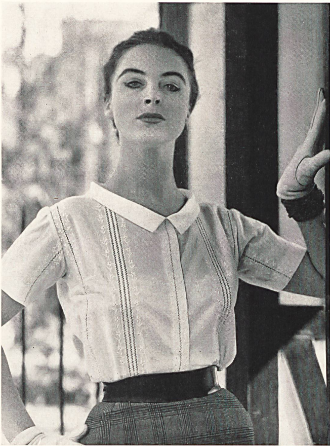
CHRISTIAN DIOR (Boutique) Printemps 1956 Batiste brodée blanche de Reichenbach & Cie, Saint-Gall Montex, Paris