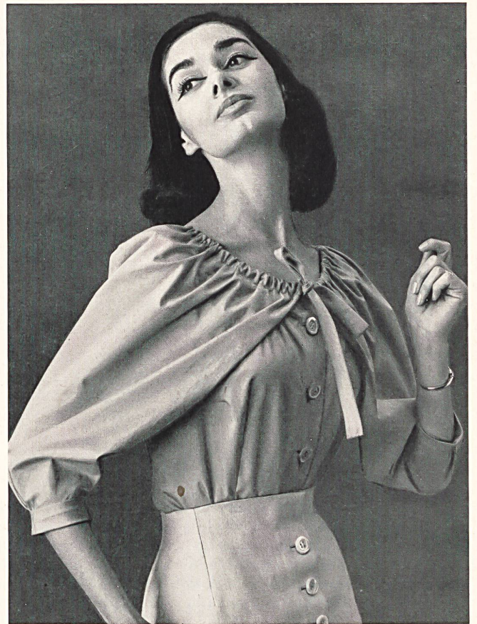
HUBERT DE GIVENCHY (Boutique) Printemps 1956