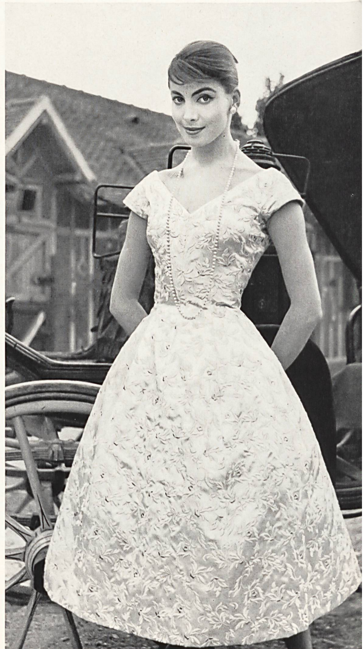
CHRISTIAN DIOR (Boutique) Broderie rose et or sur Satin Duchesse rose de Walter Schrank & Co., Saint-Gall Grossiste à Paris: Chatillon, Mouly, Roussel S. A.

Tous les documents de Paris reproduits dans ce numéro représentent des modèles réservés dont la reproduction est interdite.