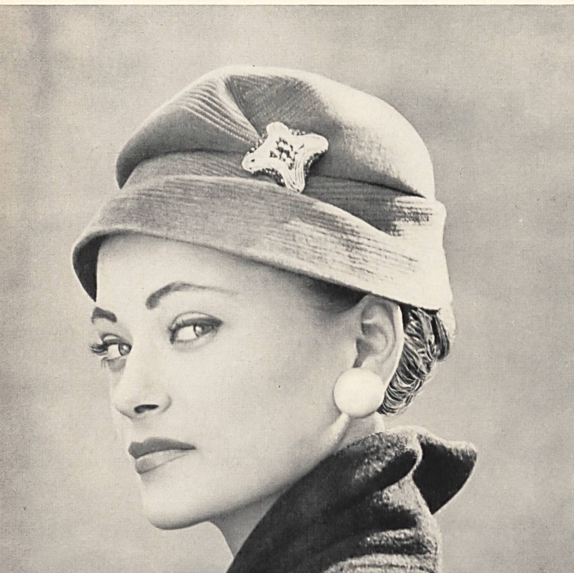
Cloche de feutre rasé piquéé. Modèle suisse. Cloche in smooth felt with stitching. Swiss model. Sombrero « cloche », de fieltro rasurado y punteado. Modelo suizo. Gesteppte, kurzgeschorene Filzcloche. Schweizer Hutmodell.

La industria suiza del fieltro — primera materia del sombrerero para la temporada de invierno — consta de numerosas empresas cuya fama alcanza mucho más allá de los confines suizos.