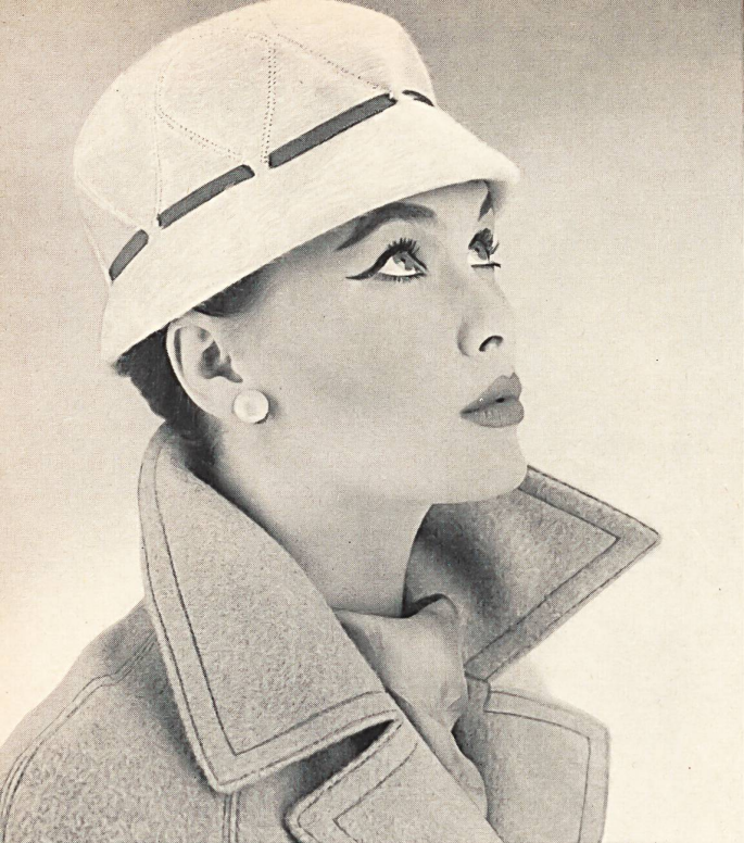
Cloche de mélusine avec ruban gros-grain et piqûres. Modèle suisse. Melusine cloche with grosgrain ribbon and stitching. Swiss model. Sombrero « cloche », de melusina con cinta de grosgrén y puntadas. Modelo suizo. Kleine Melusine-Cloche mit Grosgrainband und Steppgarnitur. Schweizer Hutmodell.