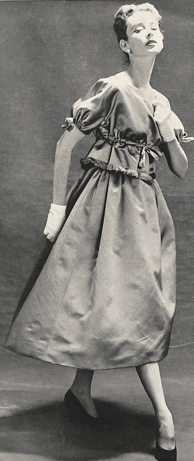
HUBERT DE GIVENCHY

Tous les documents de Paris reproduits dans ce numéro représentent des modèles réservés dont la reproduction est interdite