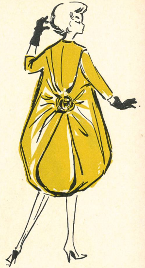
PIERRE CARDIN: manteau du soir en satin duchesse bleu turquoise; rose du même tissu.

Todas las colecciones están bajo el signo de la ilusión óptica, lo que, indudablemente, tiene su explicación. La generación actual de los modelistas es hija del surrealismo. Ha nacido después que éste y sus clásicos fueron las obras escritas, pintadas o talladas de esa escuela. Muy joven, estaba ya familiarizada con la Girafa en fuego de Salvador Dali ya fenecido, que vigila la mujer con los muslos erizados de cajones. Ha visto a la gente precipitarse hacia las tiendas de antigüedades en busca de objetos que no son lo que parecen. Y, encontrándose en una época en la que la actualidad y la preocupación por lo nuevo son unos imperativos devoradores, se vuelve hacia sus orígenes. Pero no es ésta la primera vez cuando la costura se evade de la simple noción de vestido para acceder a la fantasía. Lo que sí es nuevo es ahora la totalidad de esa evolución, mientras que ya cuando Poiret, algo antes de la guerra de 1914, escandalizaba y revolucionaba con sus atrevidos conceptos al mundillo de los modistas, aquello se debía ya al mismo impulso espiritual. A Paul Poiret le cupo en suerte el sino de los precursores y aquel fuego de artificio se apagó después del estampido de los últimos cohetes, pero las chispas tan sólo estaban aparentemente extinguidas. Bajo el acicate de la renovación solicitada mundialmente, y agujoneados por la confección de lujo