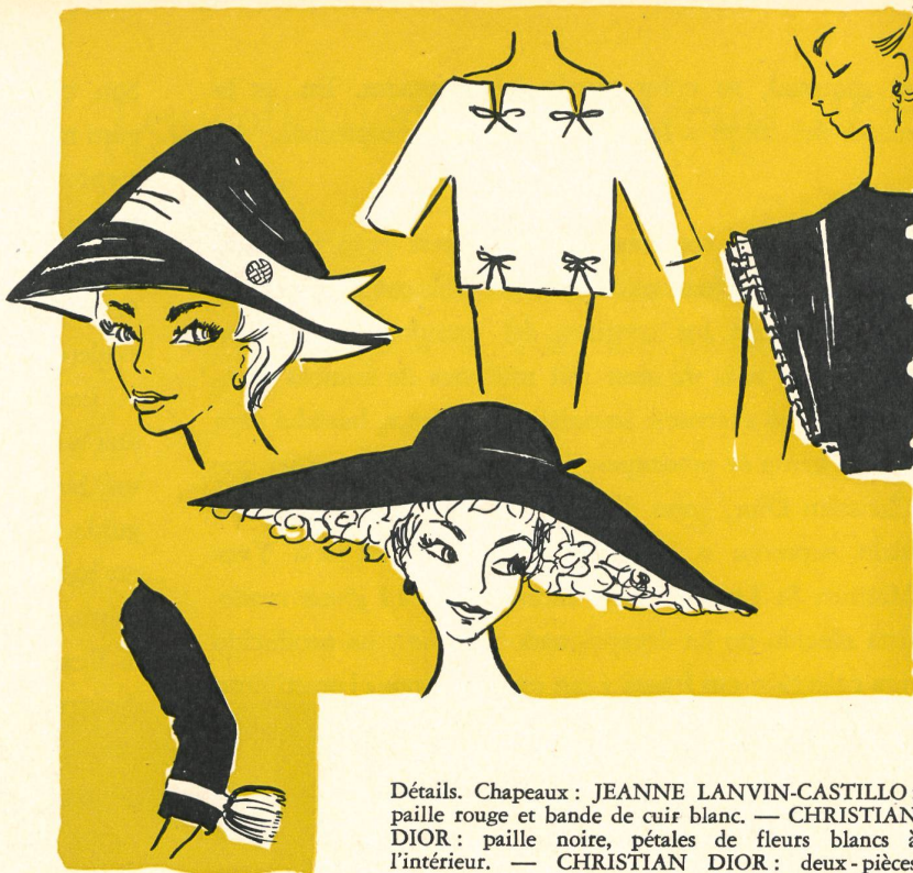
Détails. Chapeaux : JEANNE LANVIN-CASTILLO : paille rouge et bande de cuir blanc. — CHRISTIAN DIOR : paille noire, pétales de fleurs blancs à l'intérieur. — CHRISTIAN DIOR : deux-pièces avec quatre petits nœuds. — JEANNE LANVIN-CASTILLO : manche double avec tuyauté. — CHANEL : pompon de laine blanche et noire sur jersey noir.

Basta recordar los principios de Jacques Fath cuando cogía un jersey con cuello enrollado, lo cubría de lentejuelas y hacía de él un vestido de gala. Pues se trata del mismo sistema. Crear una cosa que no es lo que debería ser. Hacer una especie de modelo que se salga del cuadro clásico y que su forma,